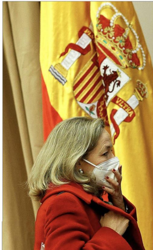
La vicepresidenta Nadia Calviño en una comparecencia reciente.

El estancamiento económico por un largo periodo de tiempo es el segundo peligro al que se enfrenta España, un riesgo de tipo económico y que hace referencia a la posibilidad de haya «un crecimiento