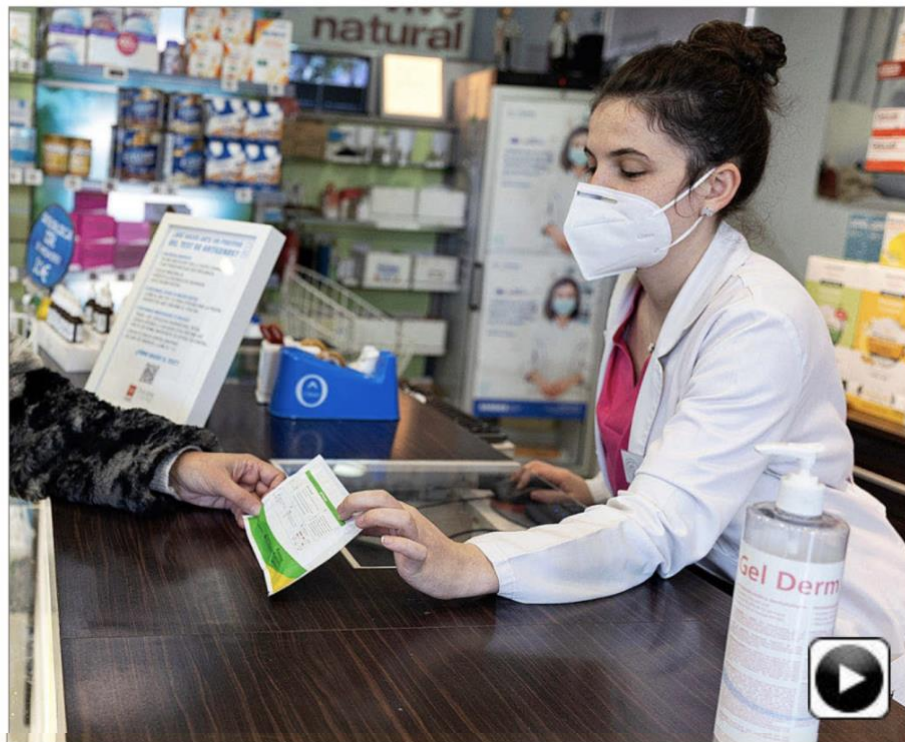
Una farmacéutica muestra un test de antígenos a una cliente en su farmacia.

La ministra Portavoz, Isabel Rodríguez, defendió ayer, sin embargo, lo contrario en rueda de prensa en Moncloa. Dijo que el modelo elegido por el Ejecutivo en la venta de estos productos es «ir de la mano de los distribuidores farmacéuticos y los colegios profesionales por seguridad y garantía a los ciudadanos». Esta expresión provocó indignación en la Asociación Nacional de Grandes Empresas de Distribución, porque sus asociados -El Corte Inglés y Carrefour entre otros- no ofrecen ningún riesgo a los ciudadanos, en su opinión. La ministra de Sanidad, Carolina Darias, mantuvo contacto posterior con el sector aclarando que optan por las farmacias, porque es «el modelo elegido por España» y van a colaborar más con el control del uso