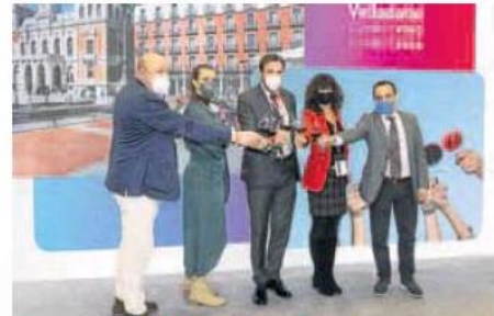
El alcalde, Óscar Puente, dio a conocer los proyectos en Fitur. A. H.

Además, el alcalde anunció el hermanamiento con el estado mexicano de Yucatán, con una de cuyas ciudades Valladolid