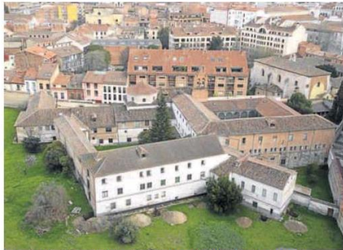
Imagen de archivo del convento de Santa Catalina de Siena, en la calle Santo Domingo de Guzmán. A. MINGUEZA

Otro de los proyectos que presentó en Fitur el alcalde, Óscar Puente, se refiere a 'Espacio Valladolid Origen'. Este último se realizará en el Museo Patio Herreriano de Arte Contemporáneo Español, en torno a un espacio que estará cen-