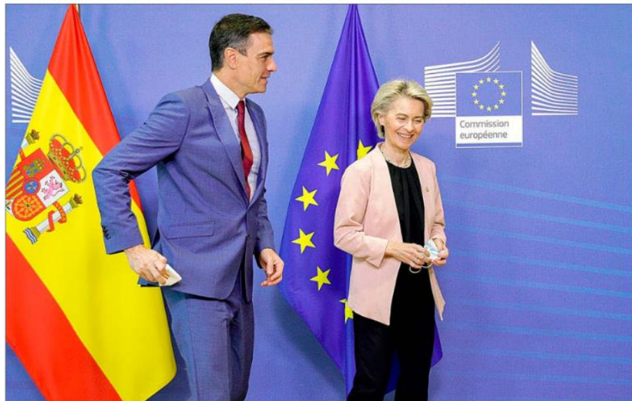
Pedro Sánchez, presidente del Gobierno, conversa con Ursula von der Leyen, presidenta de la Comisión Europea, en Bruselas.

De ese total, el Ejecutivo ha autorizado (aprobado) gastos por valor de 22.790 millones (el 94,2%); ha comprometido gastos por valor de 20.977 millones (el 86,7%) —es decir, ha relacionado ese dinero con partidas concretas en las que quiere gastar el dinero—, y ha transferido a las Comunidades Autónomas 11.200 millones para que los