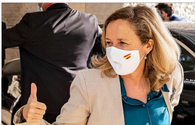
Arriba, la directora del FMI, Kristalina Georgieva; abajo, la vicepresidenta Nadia Calviño.

la inflación era algo pasajero. En sus nuevas previsiones, el Fondo estima que los precios no frenarán su subida hasta 2023. Aunque no desagrega sus datos por países, la inflación afecta a prácticamente todos los países por igual, por lo que no hay razones para pensar que España vaya a sufrir menos que las demás ese fenómeno.