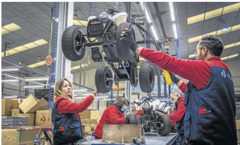
Trabajadores en una fábrica de juguetes en Alicante.

El FMI estima que la inflación global será del 3,9% en las economías avanzadas, persistiendo «por más tiempo de lo previsto» antes de ceder en 2023. Los cuellos de botella del suministro en el comercio internacional, que espera que acaben este año, también ha devaluado todo el crecimiento europeo.