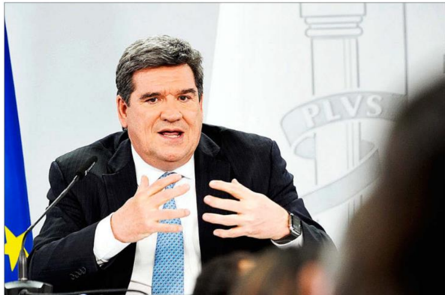
José Luis Escrivá, ministro de Inclusión, Seguridad Social y Migraciones, en la rueda de prensa de ayer tras el Consejo de Ministros. ANGEL NAVARRETE.

En materia energética, el análisis del Fondo tiene un elemento preocupante para España: la institución ha elaborado sus previsiones con una estimación del precio del crudo para 2022 un 10% más cara de la empleada por el Ministerio de Economía en los Presupuestos. Eso indica una doble tija: más inflación y, también, menos crecimiento económico. Es sólo otra mala noticia de las muchas que está deparando enero.