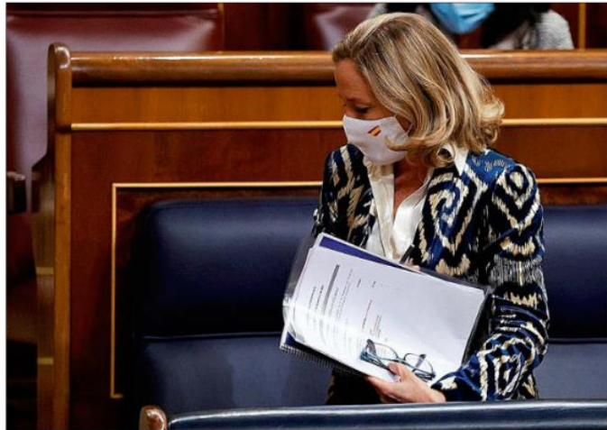
Nadia Calviño, vicepresidenta primera y ministra de Asuntos Económicos.

Este descenso de diciembre responde, en opinión de la CEC, a una «ralentización del consumo» por la incertidumbre provocada por el efecto de ómicron y