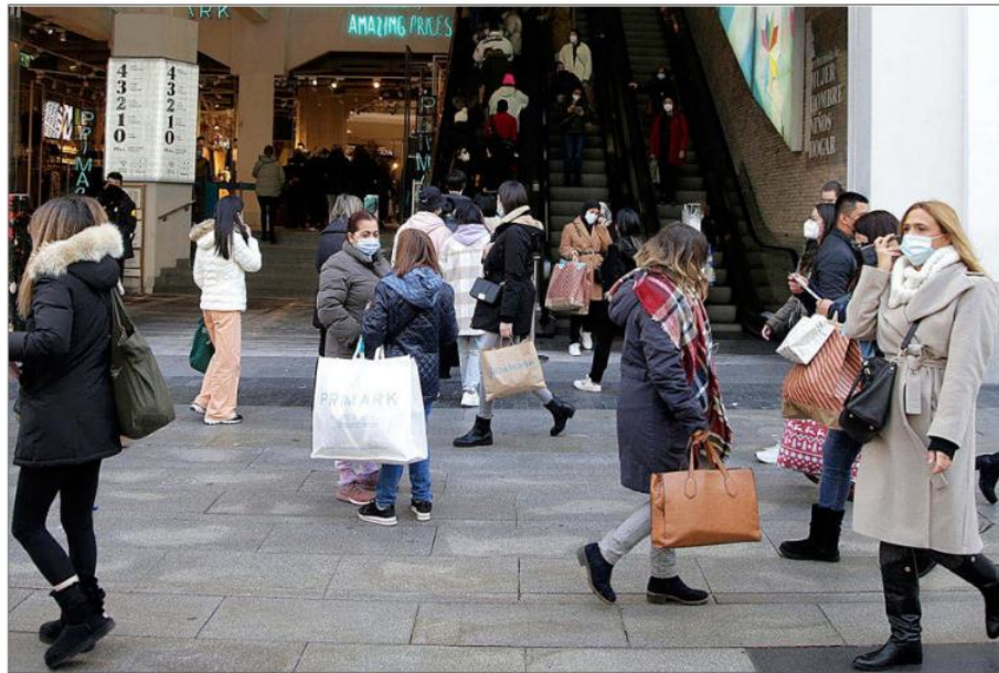
Personas de compras en la Gran Vía, en Madrid. JAVIER BARBANCHO