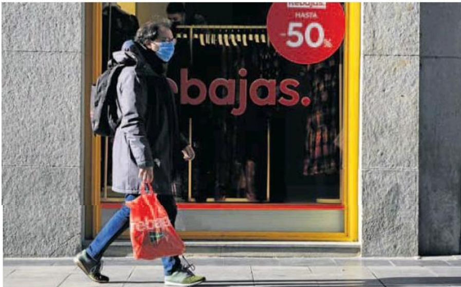
Un viandante pasea por una calle comercial de Madrid durante estas rebajas.

En Estados Unidos la inflación también ha causado estragos, con un incremento del 7% interanual, la más alta en 40 años. La semana pasada la Reserva Federal optaba por la prudencia en su primera reunión de 2022 en la que podía decidir un alza de los tipos de interés. Subirán, sí, pero posiblemente en marzo.