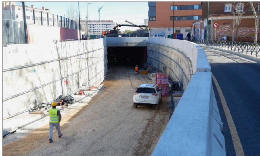
Obras en el interior del túnel que comunica las calles Andrómeda y Nochevieja.

rematar los trabajos dentro del túnel y en la urbanización del entorno. Es la fase final de las obras, aunque está por ver cuánto se alargan todavía.