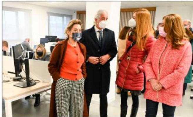
La ministra Raquel Sánchez visitó el Centro de Competencias Digitales de Renfe en Miranda de Ebro (Burgos).

gurar la línea con AVE lento pudiendo desplegar la totalidad de sus capacidades desde un inicio esperando un trimestre más, lo que en términos relativos es un suspiro comparado con la docena de años de espera para la finalización y puesta en servicio de esta línea. El calendario que se maneja desde Adif es que tras las últimas pruebas con el sistema europeo de gestión del tráfico ferroviario se pueda solicitar la autorización de Puesta en Servicio de la línea para explotación comercial a la Agencia Española de Seguridad Ferroviaria (AESF) «durante el primer semestre de 2022». Una vez que la agencia de seguridad emita su informe favorable, Renfe podrá iniciar la explotación comercial, puesto que la infraestructura de acceso de la estación de ferrocarril ya está lis-