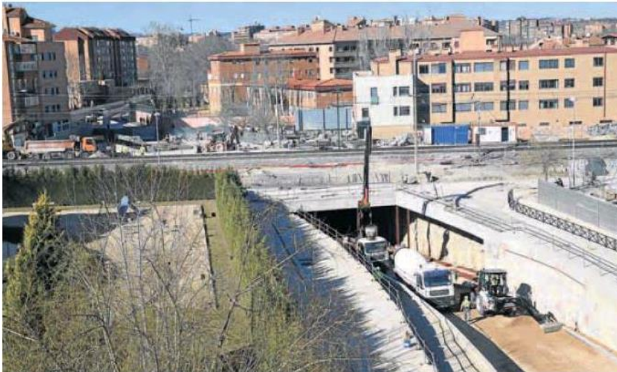
Obras en el túnel que une las calles Nochevieja y Andrómeda y que se prevé estrenar a mediados de febrero. RODRIGO JIMÉNEZ