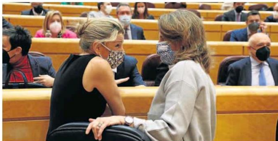
Las vicepresidentas Yolanda Díaz y Teresa Ribera, ayer durante el pleno del Senado.

Los dos socios de la coalición, sin embargo, no quieren tirar la toalla todavía con ERC y el PNV y prometen «no levantarse de la mesa hasta el último minuto» para sumar a republicanos y nacionalistas a la causa. Los trabajos son discretos y coordinados, con un argumento invariable, el de apelar a la responsabilidad de estas