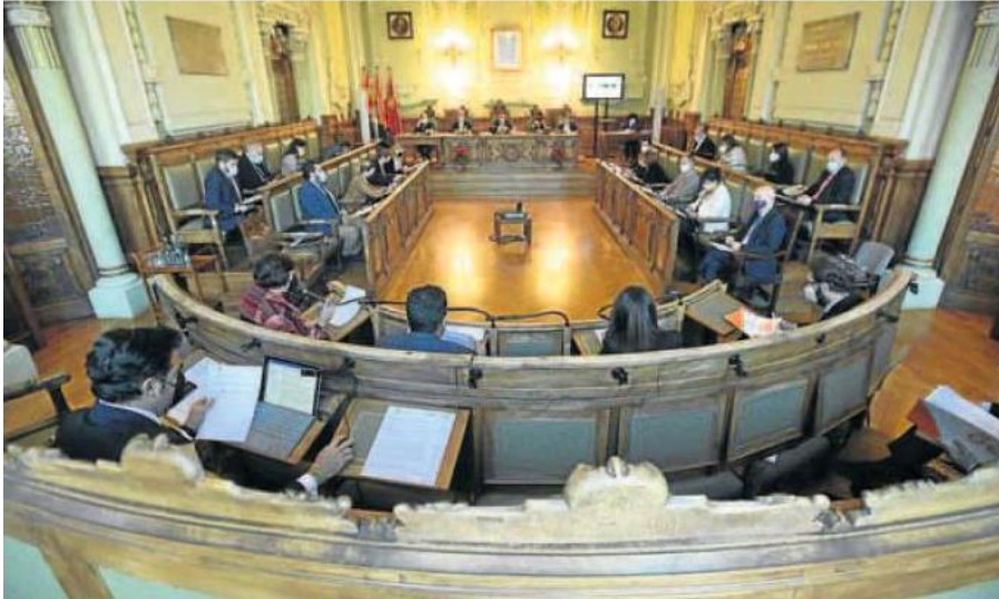
Salón de plenos del Ayuntamiento de Valladolid. RODRIGO JIMÉNEZ

El equipo de gobierno asegura que la resolución judicial es solo una corrección formal de la tramitación