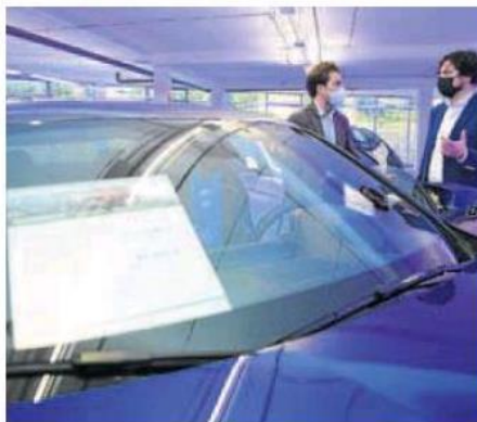
Interior de un concesionario. RODRIGO JIMÉNEZ

Bien es cierto que para comprar un coche ya no hace falta solo acercarse a un concesionario. Las ventas de enero están muy distorsionadas por la falta de stock motivada por la crisis de los semiconductores, además de por los efectos de una crisis económica a la que no se ve final. Como factor agravante, el mes