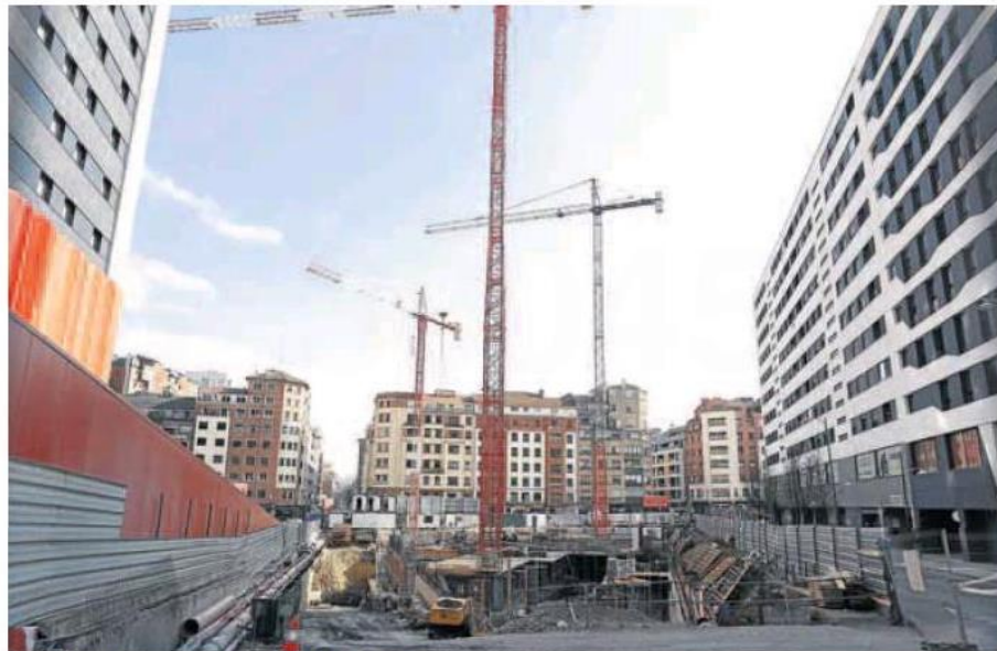
Obras de construcción de un bloque de viviendas.

Por su parte, la financiación a empresas creció un 2,9% (26.603 millones) hasta alcanzar 948.416 millones. Una deuda muy elevada que no solo llega de la necesidad de acometer inversiones acordes con el rebote económico, sino también de numerosas operaciones de reestructuración empresarial y de refinanciación.