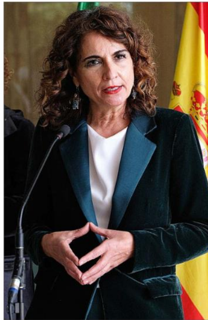
La ministra de Hacienda y Función Pública, María Jesús Montero.

El documento de Hacienda también incluye, ya más allá del ámbito de los coworking , un plan concreto para luchar contra los programas de doble uso. La Agencia Tributaria ya prohibió el pasado año este tipo de software que permite manipular la contabilidad, obligando a autónomos y compañías a tener sistemas que garanticen la integridad, la conservación y la accesibilidad a sus cuentas. Y ahora se está reuniendo, especialmente con trabajadores por cuenta propia y pequeñas y medianas empresas ( pymes ), para dar forma a un producto estandarizado que, además, pueda financiarse con los fondos europeos. El proceso está todavía en sus primeros pasos, pero la intención de Hacienda es