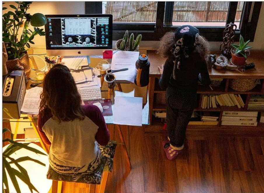
Una mujer teletrabaja con el ordenador desde su domicilio, con su hija presente en la misma habitación.