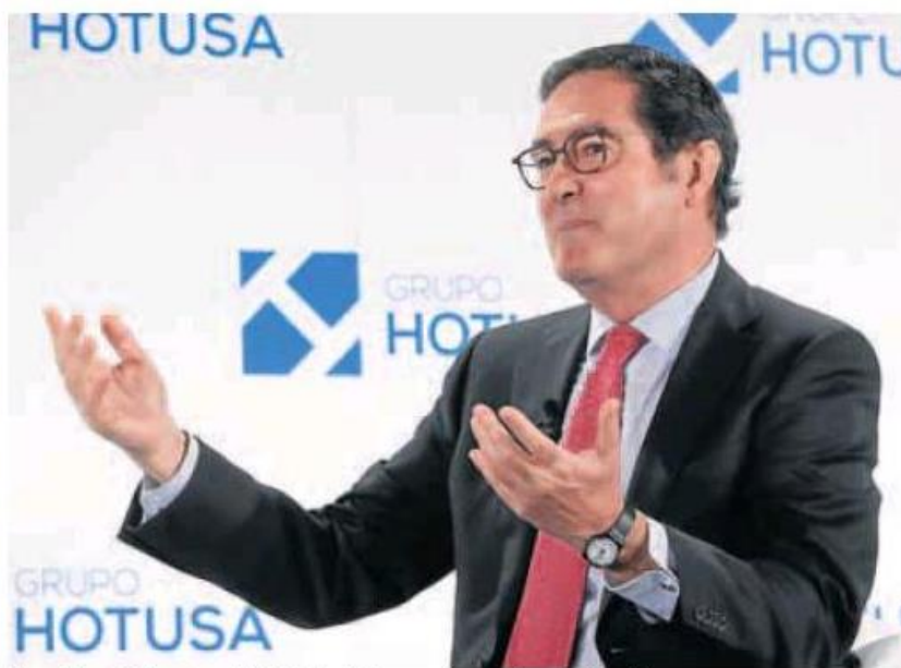
El presidente de la patronal CEOE, Antonio Garamendi, en una imagen de archivo.

Antonio Garamendi insiste en que volver a subir el SMI podría provocar una «contracción importante del empleo»