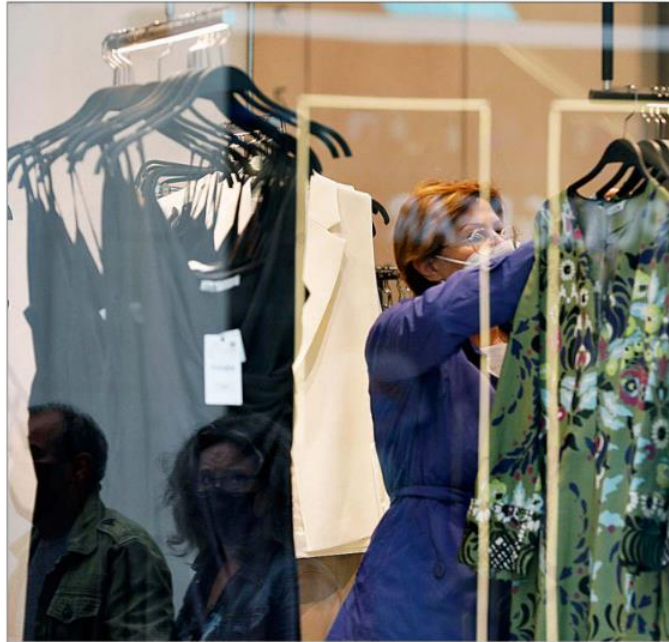
Una clienta mira vestidos en una tienda de ropa de la zona centro de Madrid.

Para Carlos Moreno-Figueroa, portavoz de la CEC, los hogares «están en una especie de impassé , a la expectativa, a ver qué pasa... El consumo se está resintiendo, porque en general hay hastío, porque la