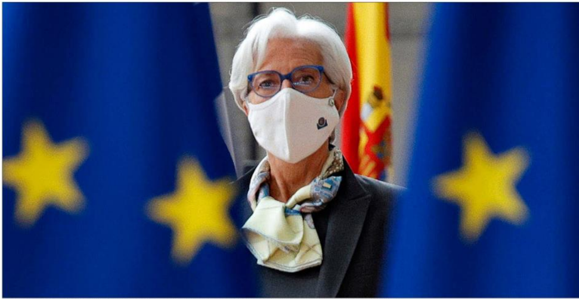
La presidenta del Banco Central Europeo, Christine Lagarde, asiste a una cumbre de la UE en el edificio del Consejo Europeo en Bruselas.

Más de lo esperado. Es la subida de los precios que registró la Eurozona en el mes de enero.