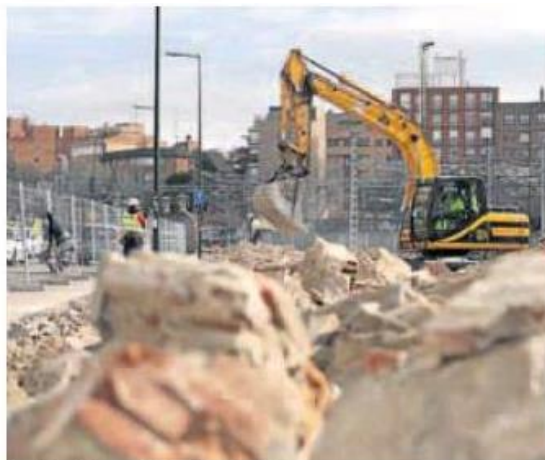
Derribo del muro de la calle Estación. IVÁN TOMÉ

El alcalde de Valladolid y principal defensor del triple paso, Óscar Puente, destacaba en su cuenta de Twitter que «los trabajos del paso de Labradores/Panaderos siguen su curso imparable. La integración también derriba muros. Pero de verdad. No en los mundos de yupi». Además, hace unos días anunciaba el final del