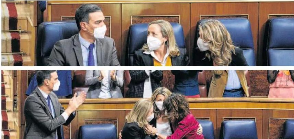
De la angustia al alivio. Las reacciones de Sánchez y sus vicepresidentas cuando el decreto parecía derogado y después, una vez ratificada su aprobación.