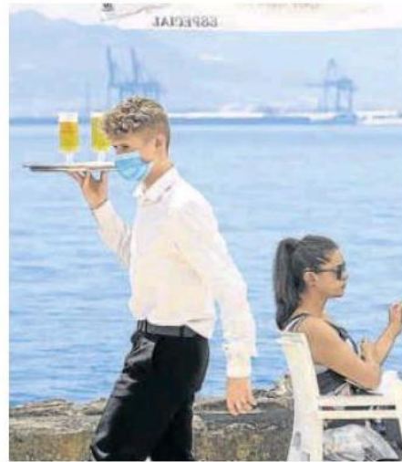
Un camarero en un bar de Málaga. R. C.

Esta normativa laboral está en vigor ya desde el pasado 31 de diciembre, un día después de su publicación en el BOE, aunque se estableció un periodo transitorio ('vacatio legis') de tres meses para que las empresas puedan adaptar los contratos temporales y los ERTE a la nueva norma. Esto significa que todos los contratos vigentes firmados con anterioridad al 31 de diciembre podrán agotar sus plazos convenidos, sin sobrepasar los límites legales. Si están ya en vigor las sanciones para reducir la rotación y todo lo relativo a la negociación colectiva.