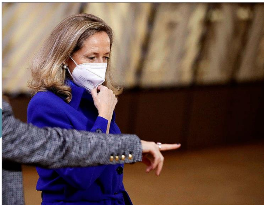
Nadia Calviño, vicepresidenta primera del Gobierno, tras una reunión del Eurogrupo celebrada a finales del año pasado en Bruselas.

El panel de analistas de Funcas es algo más optimista y eleva el impacto estimado de los fondos hasta los 1,5 puntos de PIB para este