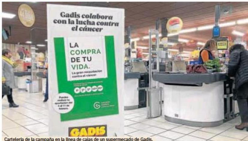
Cartelería de la campaña en la línea de cajas de un supermercado de Gadis.