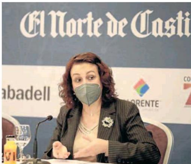
Magdalena Valerio, en un momento de su intervención en el Foro Económico de El Norte.

Asimismo, hizo hincapié en el compromiso europeo adquirido para reformar el Sistema de Seguridad Social, condicionante para recibir los fondos europeos incluidos en el Plan de Recuperación