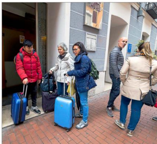
Un grupo de turistas sale de un hotel de la Comunidad, antes de la pandemia.

A este hecho, añade la asociación de empresarios hoteleros, se unen «unos costes de los suministros más elevados que nunca». Y