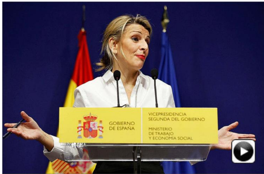
Yolanda Díaz, vicepresidenta segunda y ministra de Trabajo, ayer, en una rueda de prensa.

La norma será analizada por los agentes sociales, aunque para aprobar este incremento no es necesario el acuerdo en el diálogo social, tal y como recordó la ministra. El Gobierno únicamente debe consultarles e interesarse por su opinión, pero puede legislar sin que