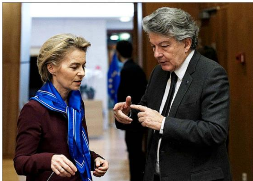
La presidenta de la Comisión Europea, Ursula von der Leyen, con el comisario del Mercado Interior, Thierry Breton.

La propuesta es una de las ideas estrellas del francés, y la presidenta Ursula von der Leyen ya ha hecho suyo el proyecto, pero en la capital comunitaria hay dudas: sobre la capacidad real de movilizar ese dinero, sobre la legalidad de algunas de sus implicaciones, pues el equipo de Competencia que dirige la danesa Margrethe Vestager ve