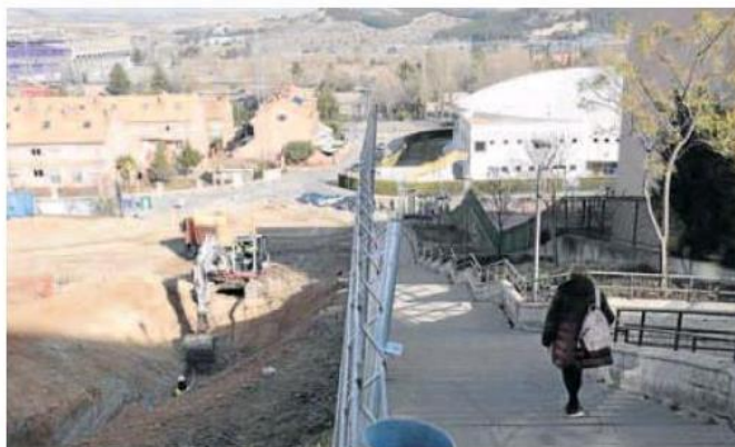
Obras de un ascensor de Parquesol, proyecto para el que se ha pedido financiación europea. CARLOS ESPESO

A esta línea, se suman otros 1.124.388 euros para el comercio. En concreto para ayudas de modernización y puesta en valor de los mercados municipales. Así, este ingreso ayudará a pagar las obras de remodelación de las Galerías Rondilla, en proceso de licitación de las obras. Además, se