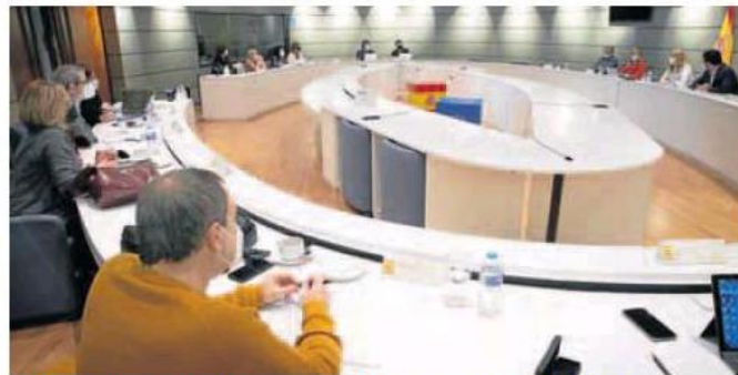
La ministra de Trabajo, Yolanda Díaz (segunda por la derecha), ayer, con los agentes sociales.

Fuente: Ministerio de Trabajo