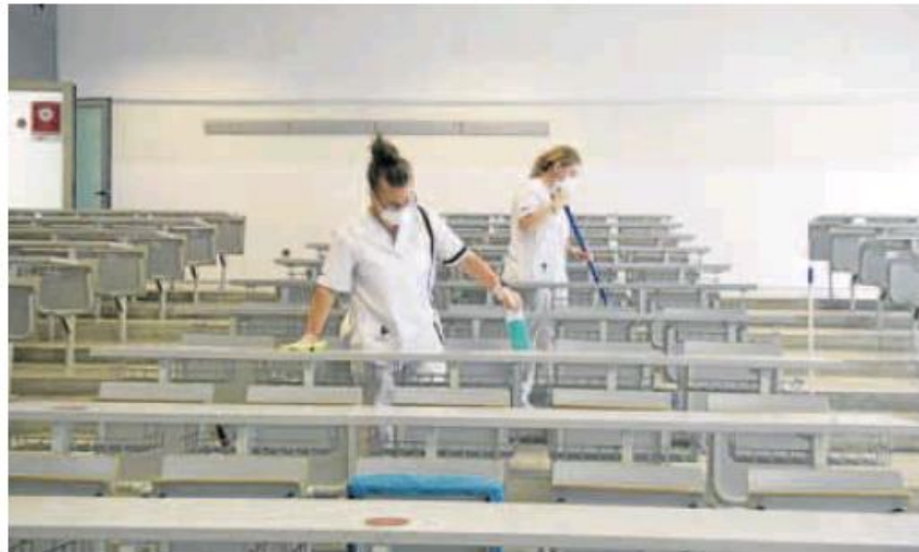
Dos mujeres limpian un aula. NACHO GARCÍA

Hay un dato más, el que aporta la Agencia Tributaria, que lo sitúa en algo más de 370.000 asalariados, aunque con una salvedad. Su estadística se refiere al número de personas que declararon ingresos salariales iguales