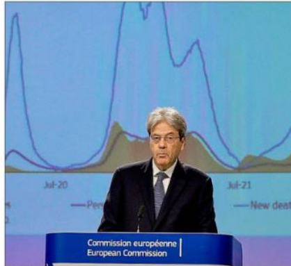
Paolo Gentiloni, ayer, en Bruselas.

nifiesto que cada vez soportan mayores cargas normativas que les obligan a ampliar el coste que trasladan al usuario. Entre las mismas, ponen de relieve las mayores contribuciones que tienen que hacer por la aportación de biocarburantes, cuya exigencia ha ido creciendo año a año, o las aportaciones al Fondo Nacional de Eficiencia Energética. Según explican, si un Gobierno decidiera llevar a cabo la subida o bajada de los impuestos que gravan la gasolina o el gasóleo A, el precio del combustible podría verse directamente más afectado por esta acción que por las tensiones en los precios internacionales.