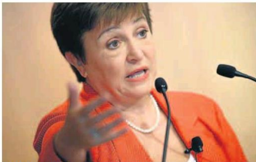
Kristalina Georgieva, directora general del FMI.