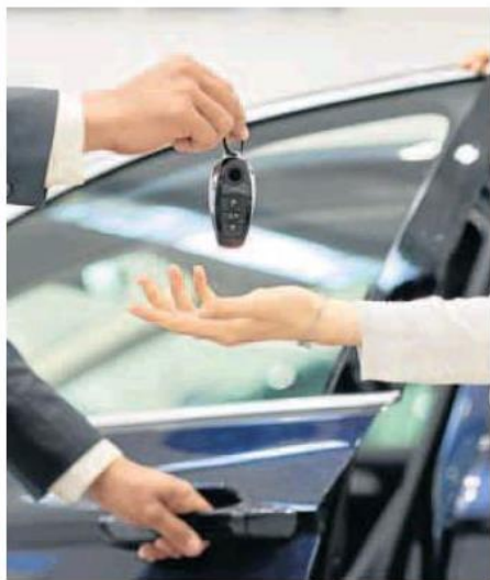
Una cliente recoge un coche de alquiler. ■ c.

años y que en 2021 alcanzó su máxima expresión. Al cierre de diciembre, había en la comunidad 3.440 empresas con coches en esta modalidad, de las que la inmensa mayoría (2.887) eran pequeñas, con flotas de entre unos y cuatro vehículos.