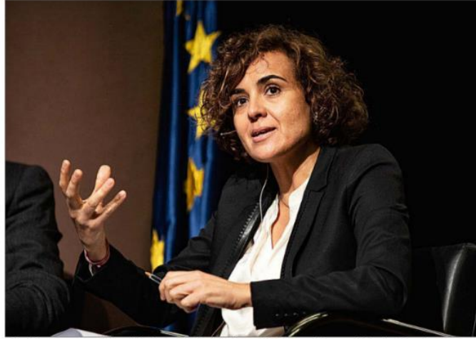
Dolors Monteserrat, en un debate de la Comisión de Medioambiente del Parlamento Europeo celebrado en Barcelona.

La delegación española del PP en el Parlamento Europeo basó sus enmiendas en la defensa de la die-