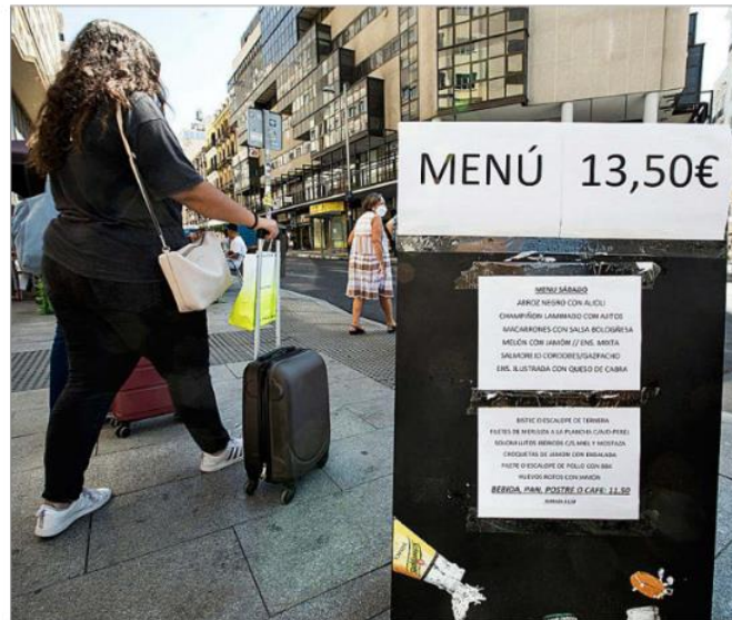
Carteles de menú del día en un restaurante cerca de la plaza de Callao, en Madrid.

Sobre la inflación, el texto apunta que el IPC alcanzó en diciembre el récord de los últimos 30 años impulsada por el efecto base—de las bajadas de precios de 2020—y por el continuo incremento de los precios del gas. Y para 2022 prevé que siga al alza. «Es probable que