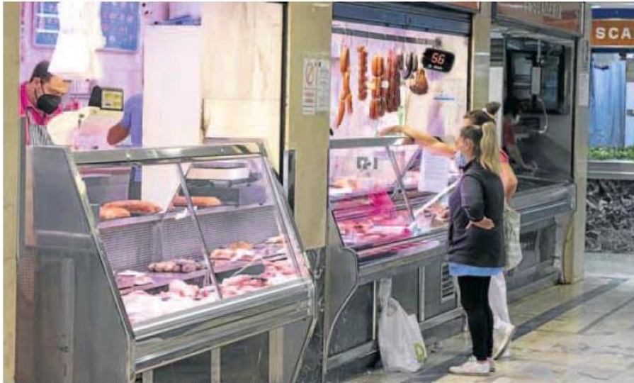
Cientas realizan sus compras de alimentación en las Galerías Rondilla, situadas en la calle Moradas. ALBERTO MINGUEZA

Las instalaciones cerrarán el próximo 1 de marzo y la ejecución de las obras se prolongará durante nueve meses