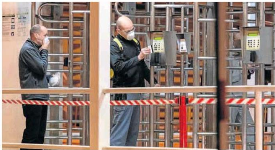
Trabajadores fichando en una planta de automoción de Sevilla, en una imagen de archivo.

«Sabemos que existe una relación entre la extensión de la jornada y problemas de salud física y mental de los trabajadores, por lo que puede tener repercusiones muy negativas», advirtió Carlos Gutiérrez, secretario confederal de Estudios y Formación Sindical de CC OO. Por su parte, Mari Carmen Barrera, secretaria de Políticas Europeas de UGT, resaltó que «no es la medida que querríamos, pero sí nos viene bien a nuestros propósitos, porque el debate está ya sobre la mesa».