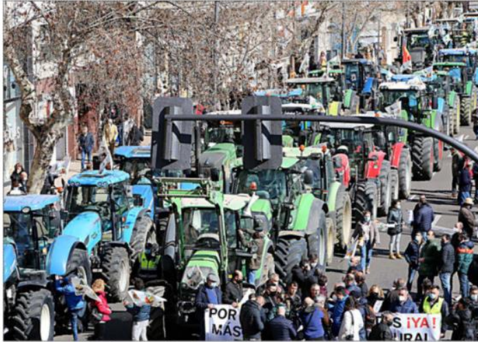
Tractorada convocada por Asaja, Coag y Upa en la capital zamorana contra el incremento de costes, ayer.

Redacción, Administración y Publicidad: C/ Manuel Canesi Acevedo, nº 1, 47016, Valladolid Teléfono: 983 42 17 00, Fax: 983 42 17 17. E-mail de Redacción: inform@ceoev-almendo.es ; local.vap@v-almendo.es E-mail de Publicidad: publicidad.vap@v-almendo.es