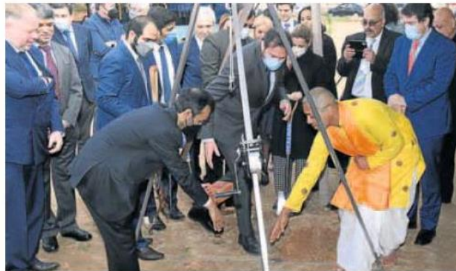
Acto de colocación de la primera piedra de la fábrica en el que participó un clérigo hindú. R. JIMÉNEZ

Valladolid daba así la bienvenida al futuro de la movilidad eléctrica entre olor a incienso hindú, con los «buenos auspicios» proclamados por el clérigo que ha dado color a la ceremonia, pero con una trastienda que pone en primer plano que con una inflación por encima del 8%, la conflictividad social no ha hecho sino empezar.