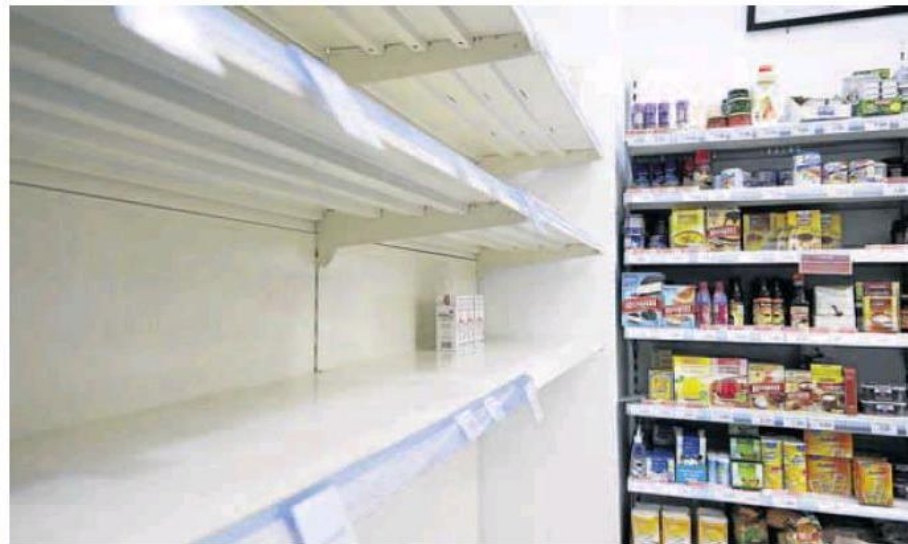
Un lineal de leche vacío en un supermercado de Sevilla por la protesta de los transportista. «»

Una de las peores consecuencias de este paro de parte del transporte ha sido la suspensión