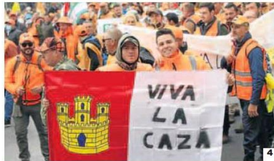
1. Varios manifestantes con pancartas y banderas durante la marcha por el mundo rural en Madrid.