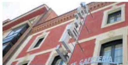
Fachada de un hotel en Medina de Rioseco. H. G. M.

MEDINA DE RIOSECO. La Ciudad de los Almirantes de Castilla registra ya una casi total ocupación de las plazas hoteleras para los días grandes de su Semana Santa, el