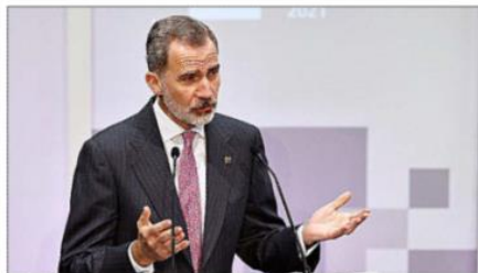
Felipe VI durante su discurso en el Premio a la Pyme del Año.

Desde el auditorio de la sede del Santander España, Don Felipe recordó que las pymes son «la columna vertebral de nuestro tejido