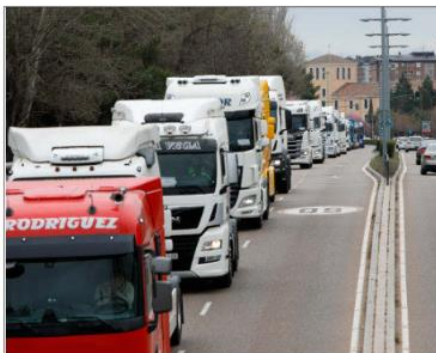
Caravana de camiones en Valladolid con motivo de las protestas. J. M. LOSTAU

Así se lo comunicó en primer lugar a los responsables de las agrupaciones de Castilla y León representadas en el Consejo Nacional del Transporte por Carretera (CNTC), que pertenecen a CETM y FITRANS. En la tarde de ayer y durante los próximos días se seguirán realizando reuniones por sectores y comisiones de asistencia para ir adoptando medidas ante la evolución de los acontecimientos.