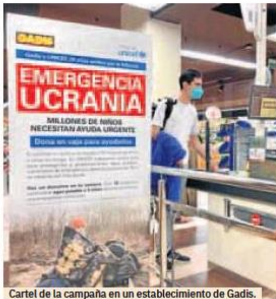
Cartel de la campaña en un establecimiento de Gadis.

Hasta el 31 de marzo, los clientes pueden realizar su donación en las cajas de los supermercados con una aportación mínima de 1 euro. Para visibilizar esta colaboración y reforzar la información a los clientes, todos los puntos de venta disponen de carteles y otros elementos para concienciar de esta situación de emergencia. La organización de ayuda interna-