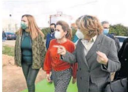
La ministra de Transportes (centro), a su llegada al acto. R. A.

en los antiguos terrenos de Acor la carretera vieja de Santander, han estado en todo momento aseguradas por la presencia de una decena de furgones policiales y varias decenas de agentes.