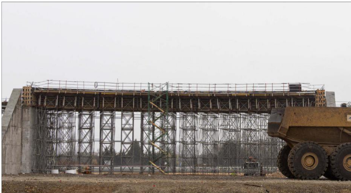
Aspecto actual de las obras en la Autovía del Duero en el tramo cercano a Tudela de Duero donde se construye un paso elevado.