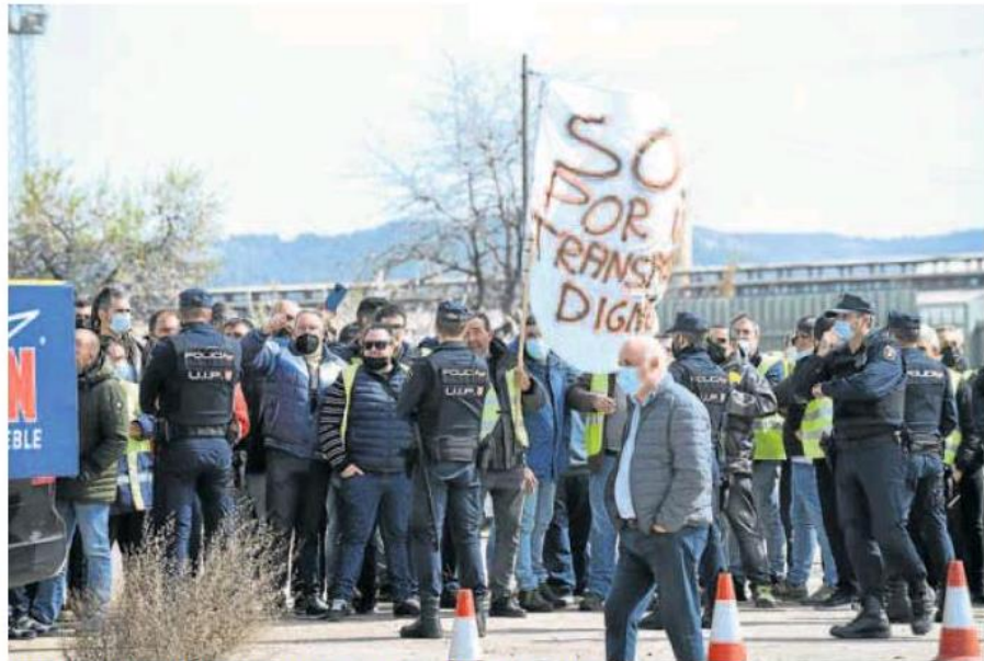
Transportistas en huelga protestan en la inauguración de la fábrica de Switch.