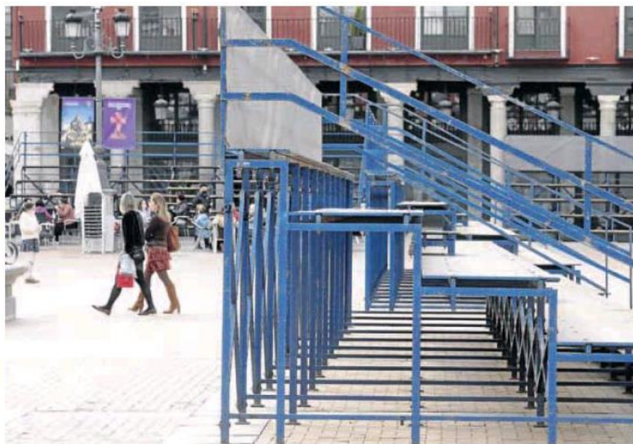
Gradas instaladas en la Plaza Mayor de Valladolid para ver los desfiles procesionales de la Semana Santa. C. ESPESO

Respecto a una posible subida de precios, Posadas tiene claro que dependerá de la ley de la oferta