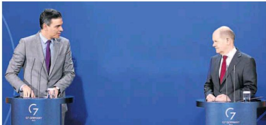
El presidente Pedro Sánchez, junto al canciller alemán, Olaf Scholz, este viernes en Berlín.

Alemania depende en un 60% del gas ruso y se niega a cambiar las reglas que garantizan su suministro