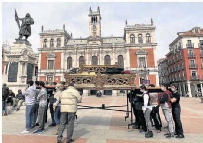
Ensayo de costaleros con unas andas en los preparativos procesionales.

de los hoteles tanto en Medina del Campo como en Valladolid aspiran a colgar el cartel de completos para los días centrales de la Semana de Pasión.