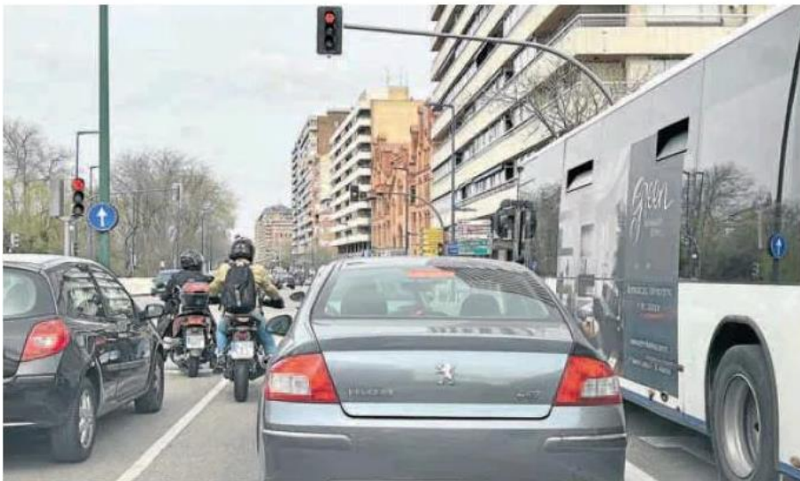
Vehículos circulan por el Paseo de Isabel la Católica.