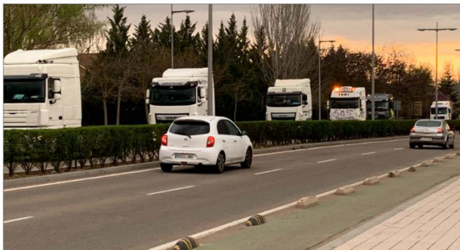
Una caravana de camiones recorrió ayer por la tarde las calles de Valladolid para protestar contra la subida de los carburantes. E. M.

«No puede ser que se trabaje a pérdidas», señala, «que sea más barato para que producir», algo que desde la Junta temen que pueda darse en varias empresas de la