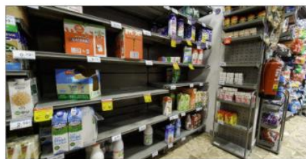
Estanterías vacías en un establecimiento de Valladolid.

vicios ni las infraestructuras logísticas esenciales se vean afectados por las actuaciones violentas de un grupo que dice pertenecer a una asociación minoritaria de transpor-