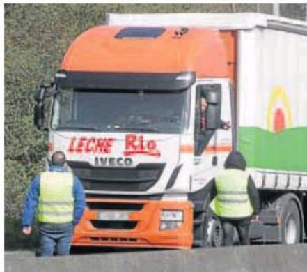
Un camión obligado a parar por los piquetes en Lugo.

Por el momento, Interior trata de sortear el bloqueo de unos paros que ya no duda en calificar de «ilegales» con la escolta de masiva de convoyes desde los cen-