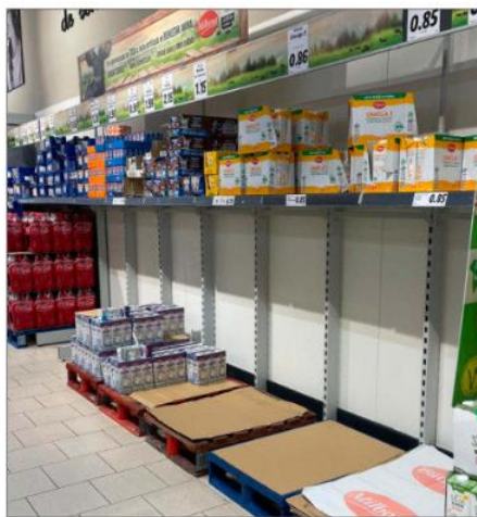
Falta de productos lácteos en un supermercado de Valladolid.