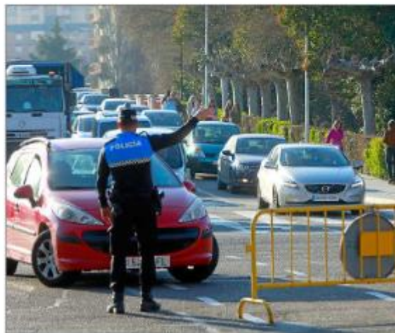
Corte del tráfico en el centro por un episodio de contaminación. E.M.

La Estrategia de Cambio Climático supone la adhesión de la Misión 100 Ciudades Inteligentes y Climáticamente Neutras, del pro-