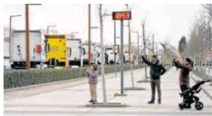
Camiones en caravana por la Avenida de Salamanca.

En todo momento, la concentración estuvo acompañada por varias dotaciones de la Policía Nacional, la Guardia Civil y la Po-