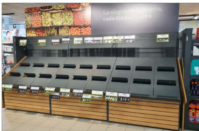
Lineal de fruta vacío en un supermercado de Valladolid este sábado por la tarde.