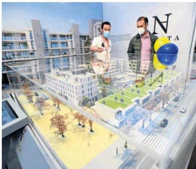
Las maquetas centraron buena parte de la atención de los asistentes.

Pese a los buenos números de la feria, que contó con el patrocinio del Ayuntamiento de Valladolid, los propios agentes admitieron que el hecho de que algunas promociones no tuvieran un precio cerrado y «la incertidumbre» de la crisis de materiales –acentuado por la reciente huelga de transportes, que ya ha parado al-