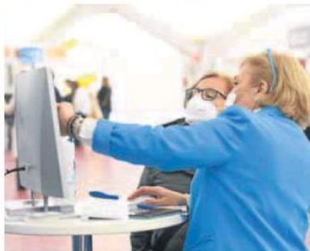
Las recreaciones virtuales ayudaron a diseñar la futura vivienda.

El evento volvió a exhibir las mejores ofertas de inmuebles de Valladolid y se confirmó como la principal feria regional