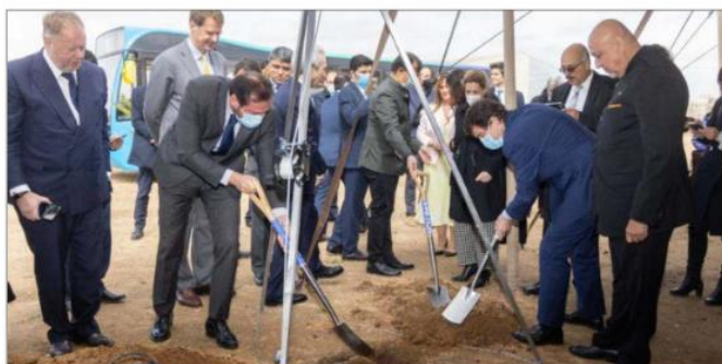
Óscar Puente y Alfonso Fernández Mañueco durante la colocación de la primera piedra.

El paquete de medidas incluye la concesión de una subvención nominativa y directa por parte del Ayuntamiento, que estará en función de la inversión que realice la empresa y de los efectos sociales que tenga el proyecto para la ciudad. La cuantía se recogerá en el presupuesto de 2023, aunque antes Switch Mobility deberá presentar sus planes industriales con