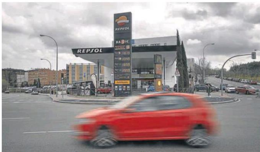
Una gasolinera con los precios de los carburantes rozando los dos euros el pasado 10 de marzo.

Esa es básicamente la razón por la que el Ejecutivo descarta una reducción impositiva generalizada. Cualquier modificación del IVA implica, además, el ras-