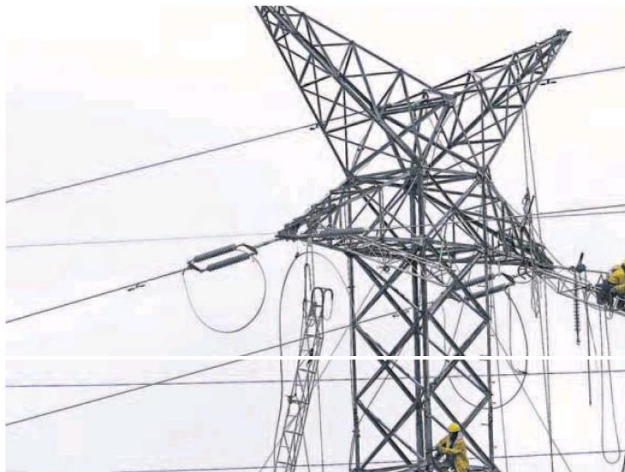
Trabajos de mantenimiento en torretas de Iberdrola en el País Vasco.

Transición Ecológica no ha dado pistas sobre ese techo nuevo de referencia. Pero fuentes del sector eléctrico calculan que una rebaja del precio del gas de 10 euros/kwh tendría un impacto de unos 25 euros en el precio de la electricidad. Esa estimación señala que en ese hipotético caso, las gasistas estarían registrando un margen alto, si se toma como referencia el precio de importación de 60 euros hasta finales del año pasado, según Competencia.