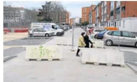
La calzada de la calle Amor de Dios, a falta del asfalto. J. S.

Las obras en sí contaban con un plazo inicial de ejecución de cinco meses, hasta el 17 de diciembre, que evidentemente se ha retrasado de manera notable hasta alcanzar ya los ocho meses. Los trabajos, no obstante, están ya concluidos en superficie tanto en Amor de Dios, entre la avenida de Palencia y Madre de Dios, como en la calle perpendicular de Nuestra Señora, que conduce a la calle Penitencia. En la primera se han adoquinado y am-