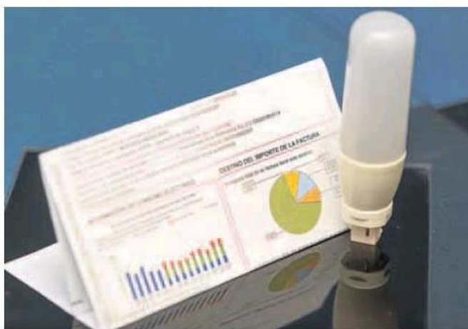
Nueva estructura. Factura de la luz de un particular.

Otro de los grandes cambios operados en el recibo en el último año ha sido el de la estructura de la propia factura. Habitualmente, un tercio de la misma iba destinado al pago de impuestos; otro tercio a la parte