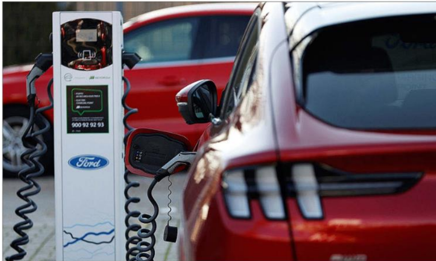
Un coche eléctrico recarga la batería en un concesionario de Madrid. EFE