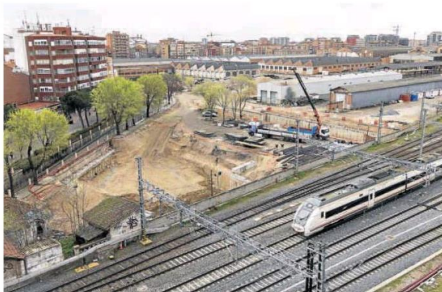
Estado de las obras en la avenida de Segovia, donde ya se ve la salida del túnel de Panaderos y el hueco del paso peatonal. JOSÉ C. CASTILLO