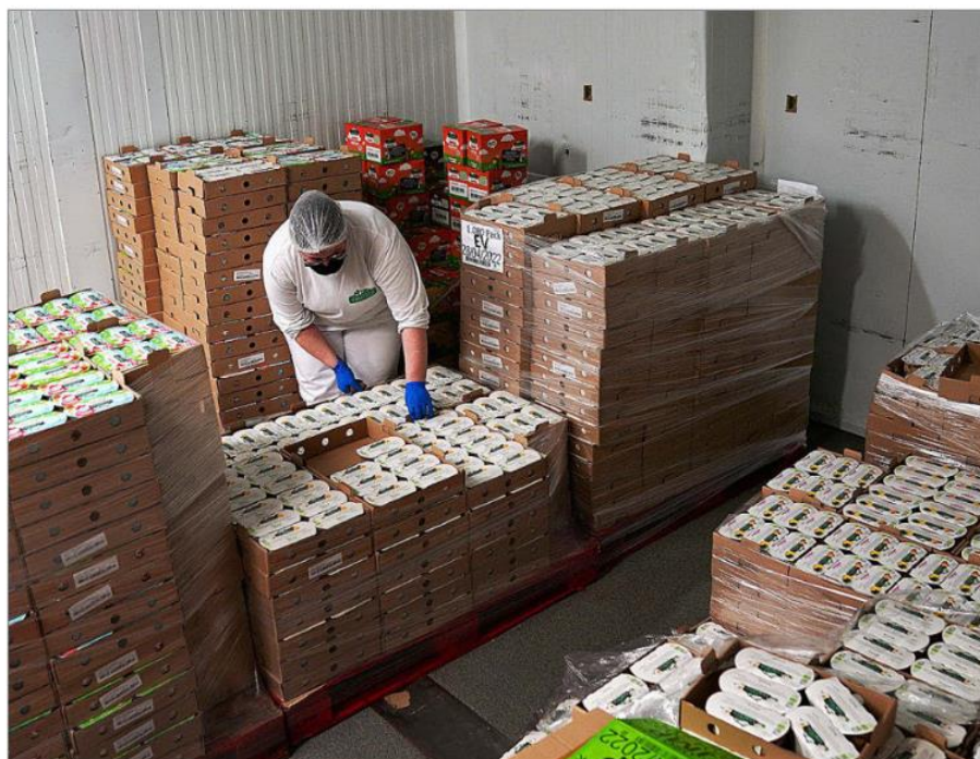
Una trabajadora de una granja de yogures gestiona el enorme stock acumulado por no poder dar salida el producto.

«El sector que haya conseguido no parar podrá volver con más facilidad a un mercado de condiciones previas», señala Luis Calabozo, presidente de Fenil, la Federación Nacional de Industrias Lácteas. Estas «plantas que no hayan parado