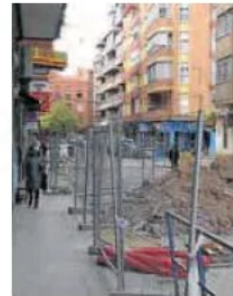
Obras en la calle Quebrada. J. S.

pliado las aceras, que ahora alcanzan hasta los cinco metros en algunos tramos; se han habilitado dos hileras que suman 120 aparcamientos (también adoquinados) en batería, y se han colocado nuevos alcorques con arbolado. Un alivio para un entorno son problemas evidentes de estacionamiento. El primer tramo de Amor de Dios, entre la avenida de Palencia y la calle Pedro