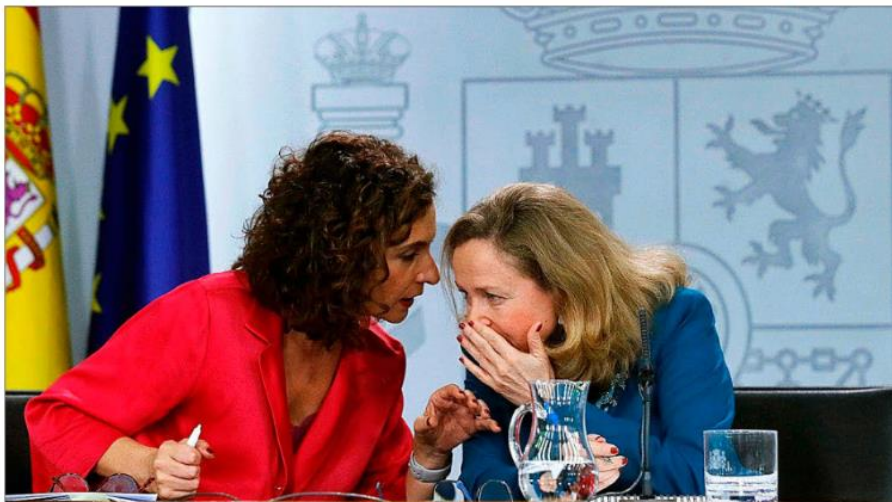
La ministra de Hacienda, María Jesús Montero, y la vicepresidenta primera y ministra de Economía, Nadia Calviño.