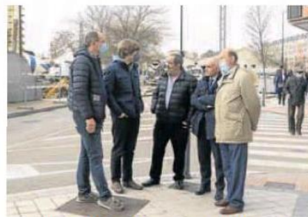
Comerciantes y vecinos de Panaderos conversan sobre la obra.