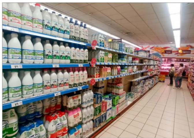
Pasillo de un supermercado de Ponferrada con plena disponibilidad de productos lácteos.

Desde la Asociación de empresarios de Supermercados de Castilla y León (Asucyl), reconocían estar muy pendientes de los