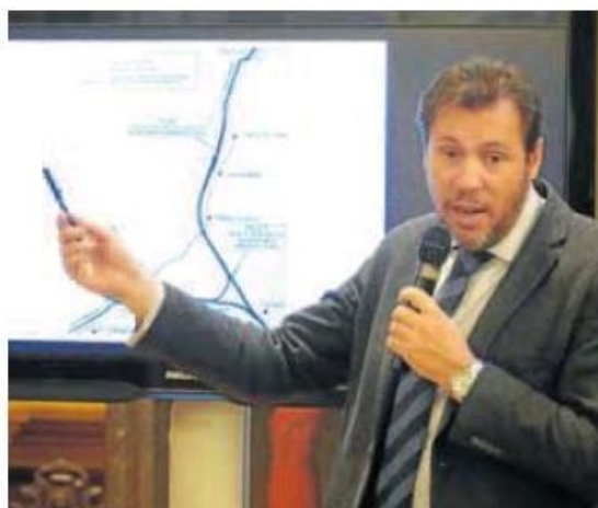
El alcalde, durante un acto para explicar el plan de integración.