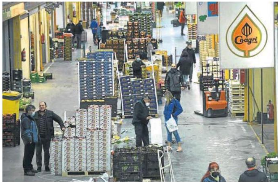
Recepción de frutas y verduras en una de las naves de Mercaolid.