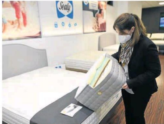
Una vendedora muestra la composición de uno de los colchones que tiene en su tienda.