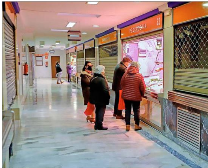
Galerías de alimentación Rondilla, un espacio que se renovará con el crédito municipal.

Casi la mitad de los 50 millones serán para inversiones de la concejalía de Espacio Urbano y Movilidad. Además de los 9,6 millones que se destinarán a los ascensores de Parquesol, habrá otros 5,4 millones para la aportación de capital que se realizar todos los años a la empresa de autobuses urbanos, Auvasa, y otros 6 para al reparación y reformas