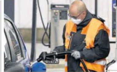
Una gasolinera ayer totalmente vacía; un surtidor que muestra en la pantalla la reducida cantidad repostada, y un empleado sirviendo combustible a un vehículo. ALBERTO MINQUEZA