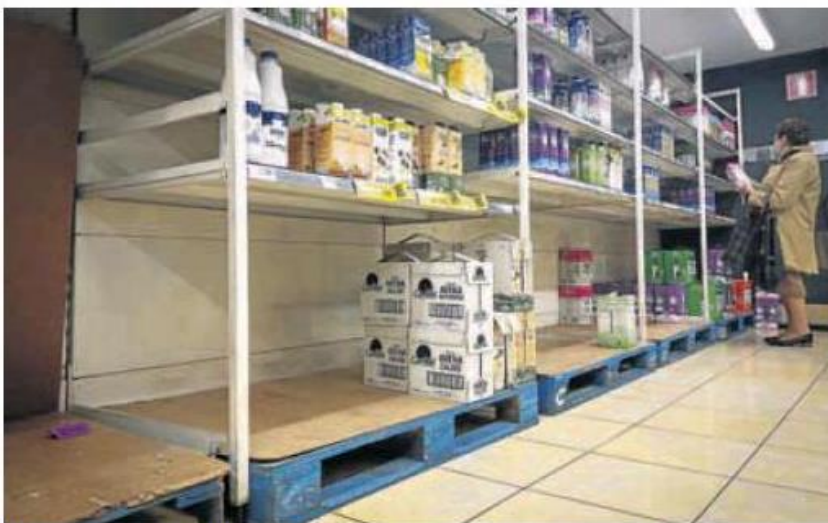
Una mujer compra leche en un supermercado durante la pasada huelga de transportistas.