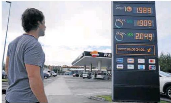
Un conductor contempla los precios del litro de combustibles en una gasolinera.

Y que no solo tira al alza del IPC la subida de la energía lo demuestra la tasa de inflación subyacente, que trepó en marzo cuatro décimas hasta situarse en el 3,4%, la más elevada desde 2008. Por su parte, el IPCA, que proporciona una medida común de la inflación para poder hacer