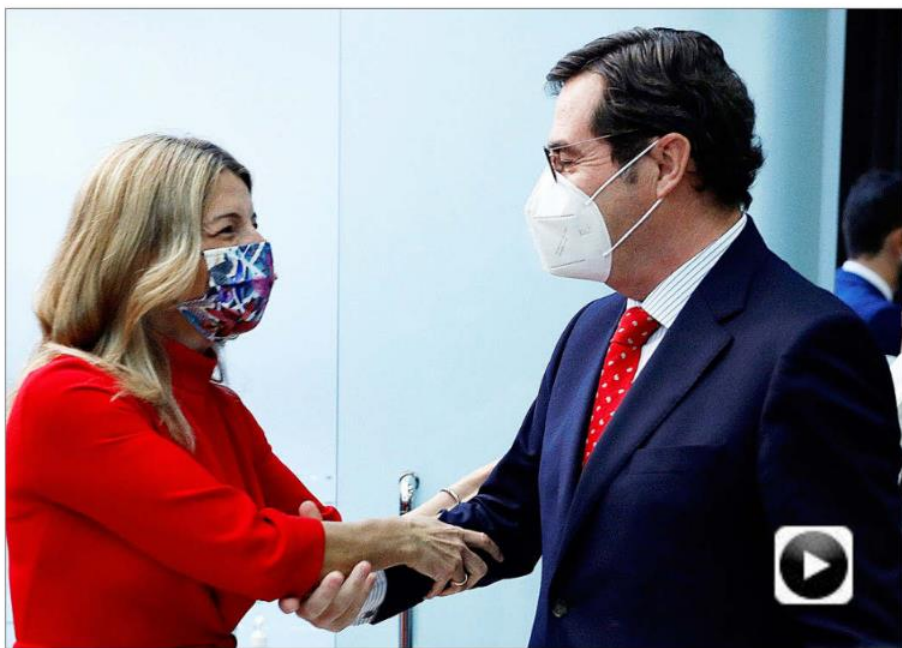
La vicepresidenta Yolanda Díaz saluda al líder de la CEOE, Antonio Garamendi, en la sede del Consejo Económico y Social, en Madrid.

Los expertos prevén que la temporalidad caerá, en parte, por un ‘efecto estadístico’