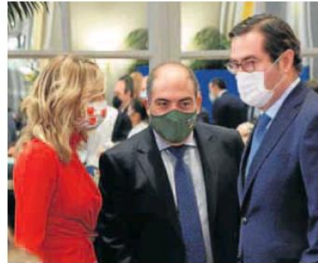
La ministra Yolanda Díaz, con los presidentes de ATA y CEOE, Lorenzo Amor y Antonio Garamendi, en un acto en 2021.

5.889 personas fueron en 2021 objeto de un despido individual en la comunidad frente a los más de 9.300 de antes de la pandemia