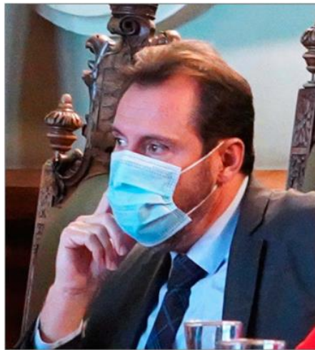
Punteo durante un pleno del Ayuntamiento. ica

El soterramiento no figuraba ayer en el orden del día del pleno aunque,