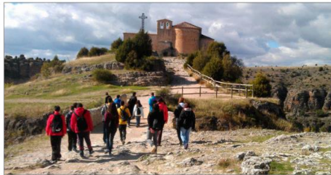
Varios turistas en las Hoces del río Duratón (Segovia).