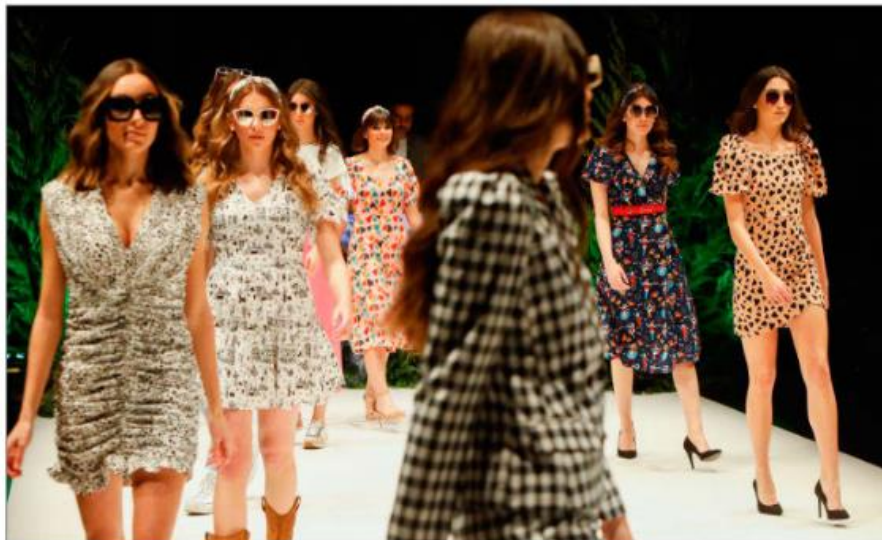
Uno de los desfiles en la primera jornada de MOVA en el LAVA. J.M. LOSTAU