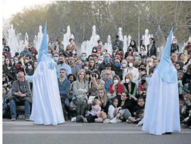
Miles de personas presenciaron el desarrollo de la procesión del Viernes Santo.

Un aspecto fundamental para que estos días se haya llenado Valladolid ha sido el buen tiempo. Con excepción de los actos programados el Viernes de Dolores