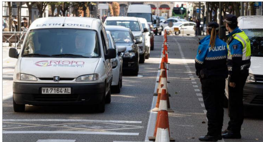
Dos agentes en el carril bus desde la plaza de Zorrilla a plaza de España que se suprimirá. J.M. LOSTAU

Al suprimir el carril bus, las tres líneas de Auvasa, la 7, 18 y 19, que, procedentes del Paseo de Zorrilla, tomaban la calle Miguel Íscar se desvían ahora por el Pa-