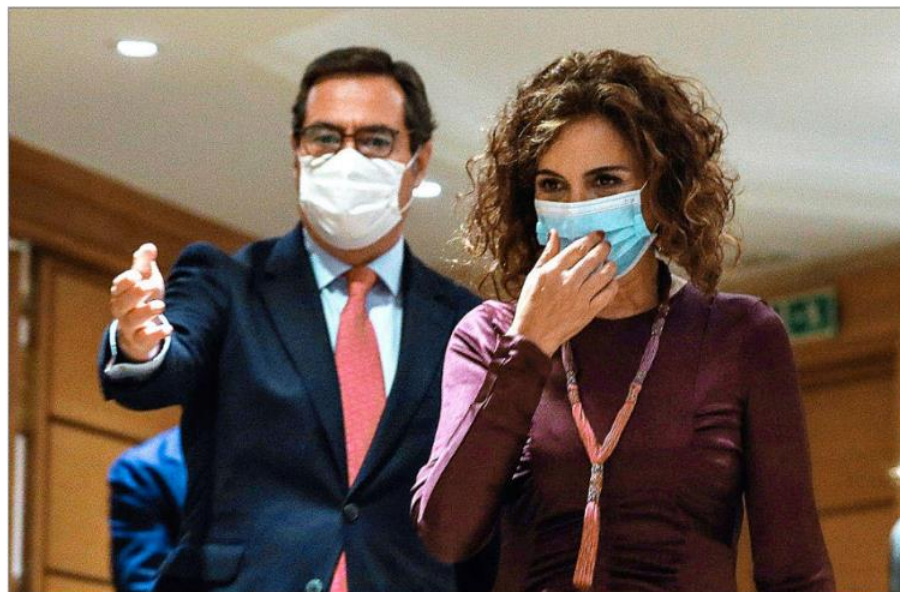
El presidente de la CEOE, Antonio Garamendi, y la ministra de Hacienda y Función Pública, María Jesús Montero.

Desde UGT afirman que lo apuntado por Sánchez «no tiene sentido» porque «son ámbitos totalmente di-