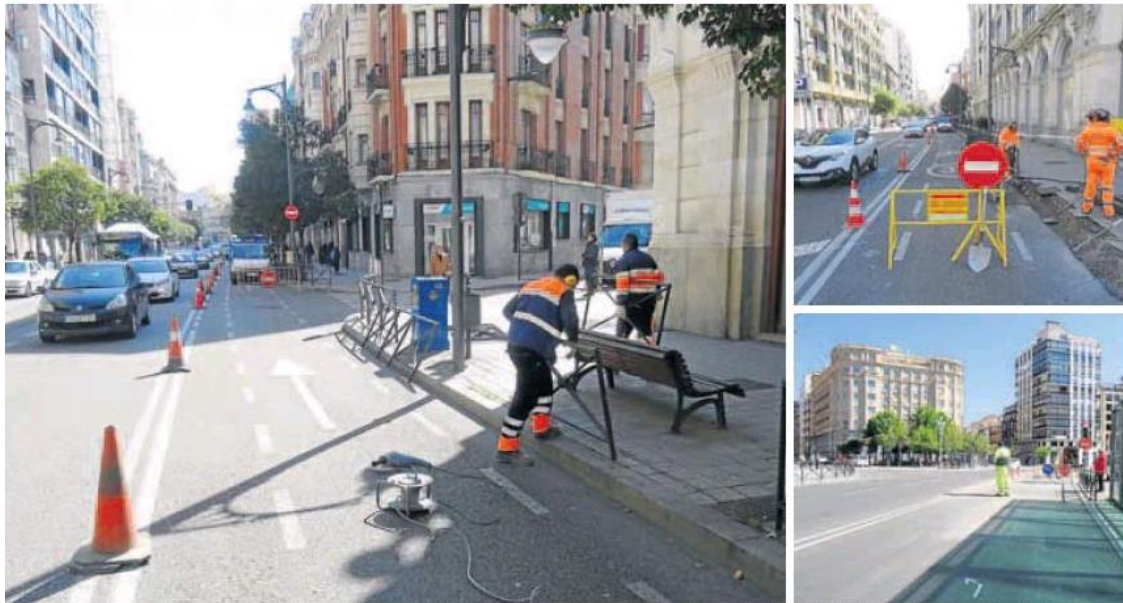
Los operarios retiran las vallas antiatropello de la acera de los pares de Miguel Íscar, junto al carril que se invertirá de sentido (hacia Zorrilla). A la derecha, señalización de la obra. J. SANZ