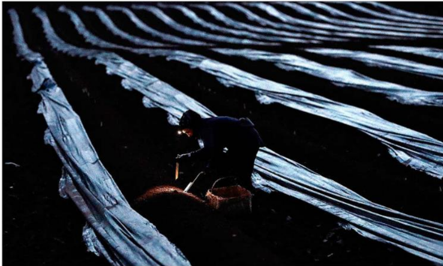
Un temporero trabajando en el campo durante la campaña de recogida del espárrago en Navarra.