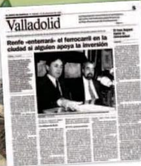
En 1990, Rodríguez Bolaños inicia los contactos para «enterrar» las vías.

sistorial. Este es un sucinto relato del 'no túnel' más famoso de la historia local.