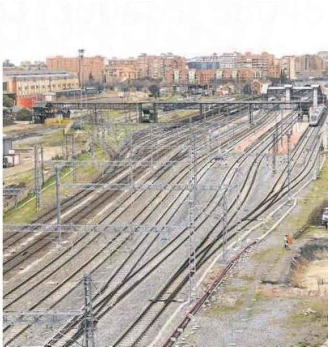
Canal ferroviario a la altura de la calle Panaderos, junto a la estación de Campo Grande.

El 7 de mayo de 2010 llega el primer susto. La valoración del suelo comienza su caída libre. Desde su primera tasación en 1.065 millones de euros pasa a 818, para continuar la rebaja a 656, 559... Hasta situarse, en 2015, en 397. Lo habían advertido los promotores inmobiliarios. Las subastas de suelo empezaban a quedarse desiertas. Tras decenas de anuncios dando fechas concretas sobre cuándo arrancaría la tuneladora, llega una primera declaración política reconociendo que la cosa se pone fea. «No nos atrevemos a poner fecha al inicio del soterramiento», decía el alcalde a finales de ese año. Pero se opta por la patada a seguir (valentía, considerarán otros), aunque ya se apunta la posibilidad de afeitar costes. No un 'low cost', pero sí una revisión de extras de los que se podría prescindir. Y llega 2011, año electoral. Las dificultades se esquinan. El soterramiento es irrenunciable, dicen todos. Hasta el punto de que el candidato socialista, Óscar Puente, se com-