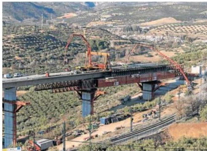
Trabajos de construcción del viaducto de una nueva autovía en Granada. ALFREDO AGUILAR

Solo en el primer trimestre el acero corrugado ya ha igualado la subida que sufrió el ejercicio pasado (21%), mientras que el cobre y la madera duplican el crecimiento mensual medio de sus precios en 2021. Peor aún es el panorama con el aluminio, cuyos incrementos mensuales están siendo más de cinco veces superiores a los del año pasado. Esta evolución alcista de horti-