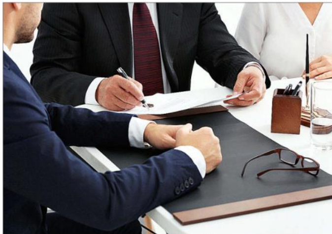
El Portal del Notariado que puso en marcha en la pandemia es el germen del nuevo proyecto.

La previsión de los notarios es que, con el Anteproyecto de Ley de Eficiencia Digital del Servicio Público de Justicia, se otorgue validez a las copias autorizadas que se envían digitalmente, las que se utilizan por ejemplo para matrimonios, divorcios, testamentos, donaciones, compraventas o préstamos. «Las medidas notariales supondrán un claro dinamizador de la economía, ya que permitirán a ciudadanos y a empresas realizar números actos o contratos sin necesidad de desplazarse,