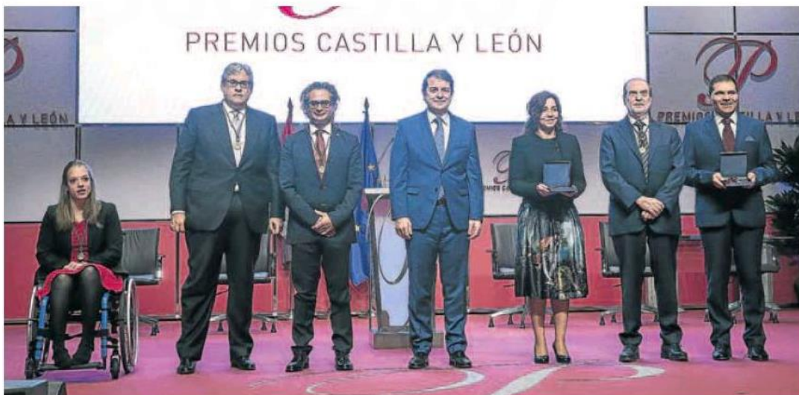
El presidente de la Junta, Alfonso Fernández Mañueco, ayer con los galardonados en los Premios Castilla y León 2021.