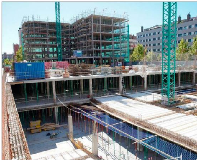
Edificio en construcción en plena pandemia en el barrio de Villa de Prado de la capital vallisoletana.

Vega reconoce que el ratio de Castilla y León en términos del sector supone alrededor del 5% del total nacional. Hace unos días, desde la Confederación Nacional de la Construcción, la patronal del sector, se hizo hincapié en esta idea, en la carencia de unos 700.000 puestos de trabajo, lo que amenaza la ejecución de los fondos europeos que llegarán a España. Y lo pone en riesgo porque, sin mano de obra, habrá proyectos que queden en el limbo, lo que llevará al sector a tener que devolver parte del montante entregado por Europa para hacer frente a la recuperación tras la crisis del Covid y ahora