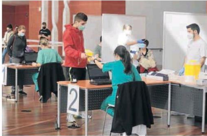
Vacunación masiva a estudiantes en el CC Miguel Delibes. CARLOS ESPESO

VALLADOLID. La recién terminada era de las mascarillas obligatorias ha dejado un reguero de cambios en el panorama económico y laboral de toda España. En consecuencia, el de Valladolid presenta hoy un aspecto más o menos diferente del que ofrecía antes de la pandemia, según sean las actividades de que se trate. La eclosión del teletrabajo, las aplicaciones móviles o la compra a distancia han dado un vuelco a las perspectivas laborales. Tras dos años de covid, tanto las ocupaciones sociosanitarias como las que tienen que ver con la educación han