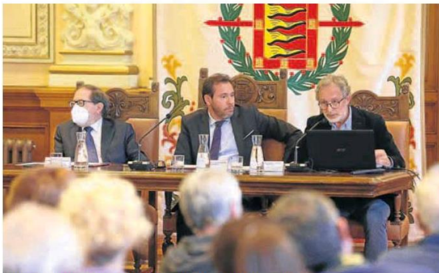
Puente y Saravia exponen sus argumentos en la audiencia pública celebrada por la tarde.