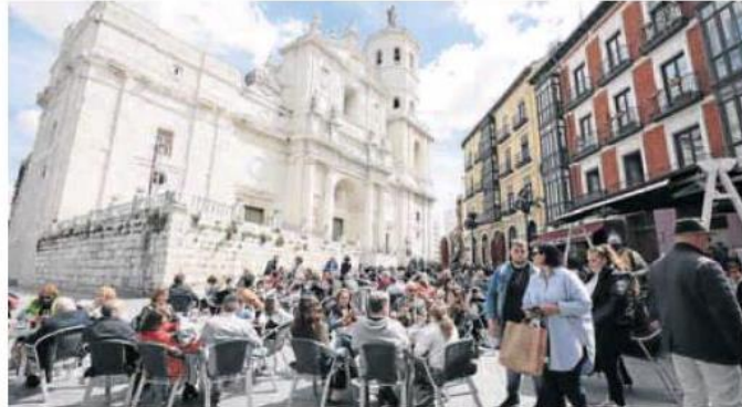
Terrazas llenas durante la Semana Santa vallisoletana. CARLOS ESPESO

El menor impacto de la pandemia favorece en mayor medida a las comunidades con una actividad más orientada al turismo nacional y los servicios personales, que son las que experimentan menores revisiones. A la vez, la participación de la energía y los combustibles en el gasto familiar