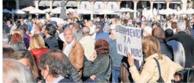
Defensores del soterramiento y concejales del PP protestan a las puertas del Ayuntamiento.