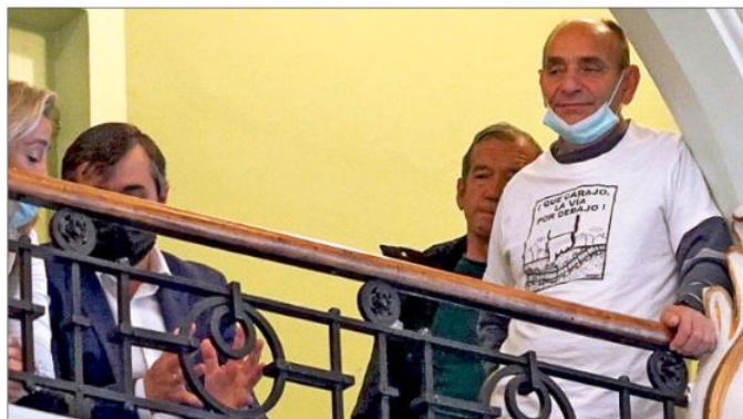
Algunos de los vecinos asistentes como público al Pleno sobre el soterramiento de Valladolid. ICAJ.