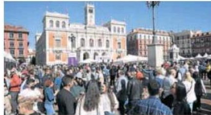
Ambiente en Valladolid Plaza Mayor del Vino en 2021. c. n.

de 150 personas, previa inscripción y pago de dos euros.