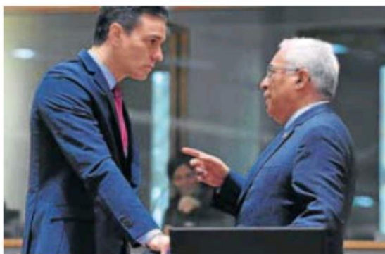
Los mandatarios de España y Portugal, Pedro Sánchez y Antonio Costa, en la última cumbre.

Ribera señaló que este documento «responde a las líneas maestras» expuestas con antelación, como introducir un sistema de doble casación. Así, habrá un precio ajustado para el mercado ibérico (España y Portugal) y otro ordinario, como hasta ahora, para que las exportaciones de electricidad a los vecinos europeos «sean retribuidas al precio que correspondería en ausencia de un mecanismo de ajuste». Era el principal temor de vecinos como Alemania o Países Bajos,