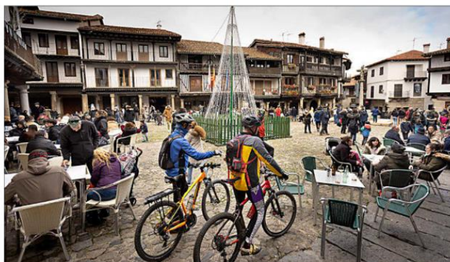
Gran afluencia de turistas en la localidad salmantina de La Alberca durante un puente, en una foto de archivo.

Poniendo el foco en el análisis del último año la fotografía de la evolución es muy diferente. Aquí sí hay diferencias colosales entre los datos de turismo rural del mes pasado y los de febrero de 2021, inmersos de lleno en la pandemia, y sin que se hubiera administrado las vacunas al