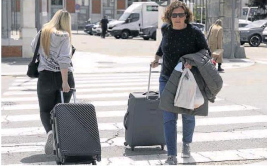
Dos mujeres arrastran sus maletas cerca de la estación de trenes de la capital vallisoletana.

que la gente empiece ya a reservar sus vacaciones», añade.