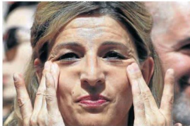
Yolanda Díaz, ayer en la manifestación del Primero de Mayo.

«Las estimaciones son complicadas, porque es muy difícil predecir la evolución del conflicto bélico, el factor fundamental que genera los efectos sobre la economía y sobre el mercado de trabajo. Sin embargo, habrá que tener en cuenta que todos los mecanismos tienen que estar perfectamente engrasados para que el empleo resista. A diferencia de la EPA, los datos que conoceremos el próximo miércoles sobre el empleo son muy positivos tanto en contratación como en datos registrados. En contratación son espectaculares y muestran que de nuevo el desempleo resiste frente a las dificultades económicas. Y este es el principal cambio que ha producido nuestro mercado de trabajo: que ha dejado de ser pura volatilidad. En términos