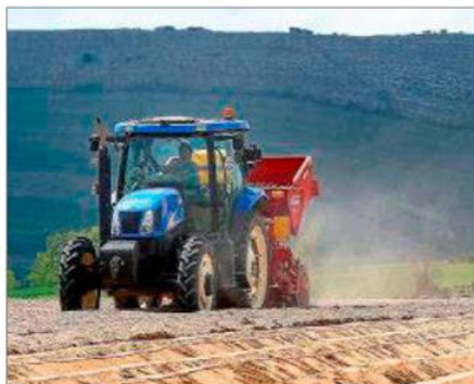
Un agricultor siembra patatas en la localidad palentina de Pomar de Valdivia. ERAGAMO

► MEDIDAS TRIBUTARIAS. En el contexto de la guerra de Ucrania, el CES urge a adoptar, en el corto plazo, medidas tributarias, de Seguridad Social y de empleo para paliar la espiral inflacionista. Recomienda, a medio y largo plazo, con carácter estratégico, reducir la dependencia de la industria agroalimentaria de Castilla y León respecto de sus proveedores externos de materias primas y energía, diversificando y/o asegurando las fuentes de suministro de los inputs productivos esenciales. Ha de aplicarse al modelo una visión estratégica que asegure y contemple el incremento a largo plazo de la capacidad productiva del sector agrario, a fin de garantizar el