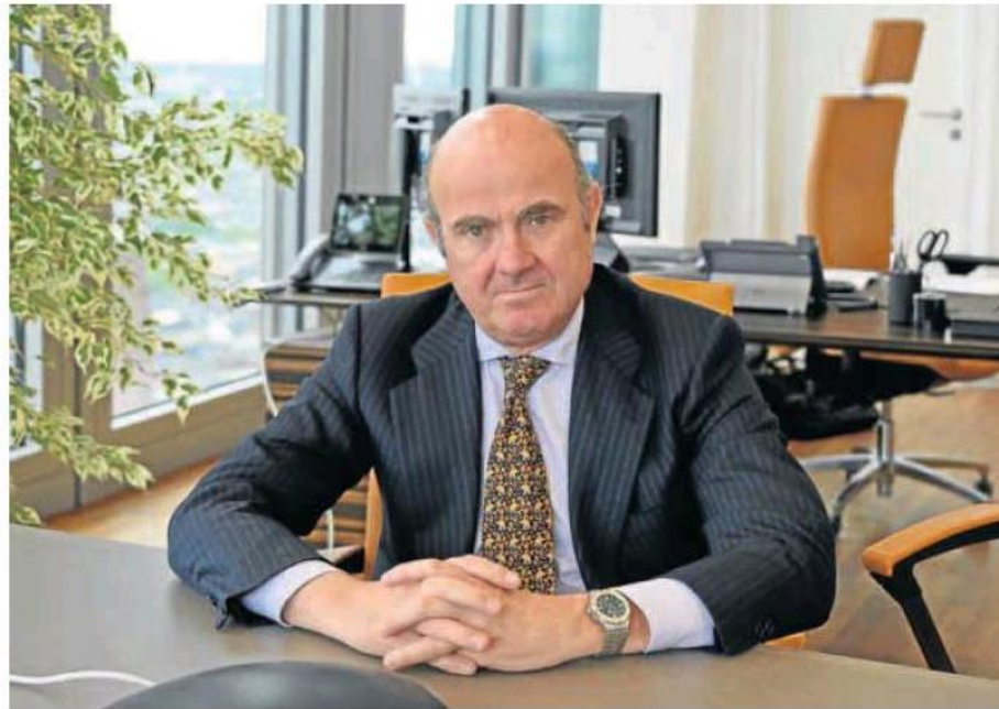
El vicepresidente del Banco Central Europeo, Luis de Guindos, en su despacho de Fráncfort. eca

—La invasión de Ucrania va a redoblar las tensiones inflacionistas y a reducir el crecimiento económico. Que materias primas y energía suban del modo en el que lo han hecho implica en la práctica un impuesto sobre trabajado-