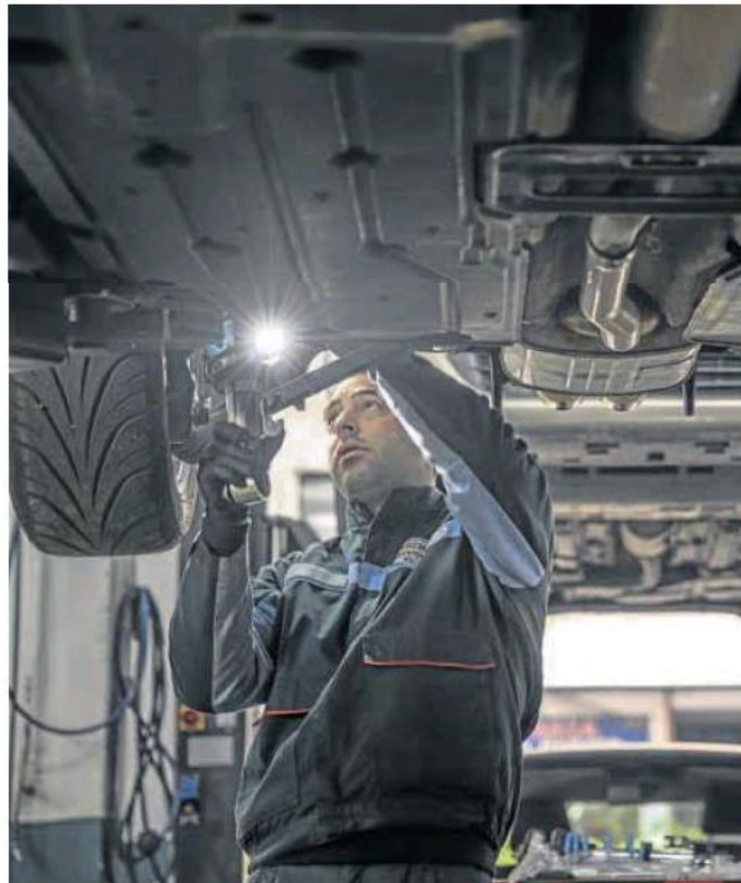
Un mecánico trabaja en un taller de automoción.

Con los datos de abril sobre la mesa, y si no se produce un cambio de tendencia, la industria del motor calcula que el mercado acabaría 2022 superando a duras penas las 800.000 matriculaciones. «Esto es algo que todos debemos mirar con mucha preocupación, por las implicaciones que ya está teniendo para la competitividad de nuestro sector y para la recuperación del resto de la actividad económica, por la fuerza dinamizadora que tiene la automoción», indican desde Faconauto.