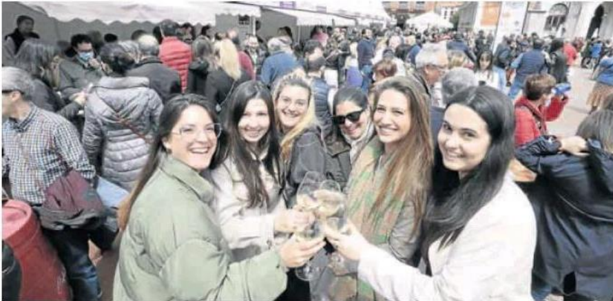
Un grupo de jóvenes brinda con un vino blanco en la Plaza Mayor.