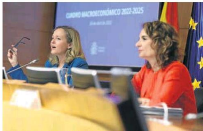
La vicepresidenta económica, Nadia Calviño, y la ministra de Hacienda, María Jesús Montero.

—Hablamos de medidas temporales y selectivas dirigidas a los sectores más vulnerables. Si las medidas se diseñan bien, la política fiscal puede ayudar a aliviar el impacto de un 'shock' de oferta externo como el actual sin que se lleguen a crear esos efectos negativos para la inflación en el medio plazo. La pandemia ha afectado a muchas empresas que ahora se ven golpeadas de nuevo. En el caso de las españolas, la reducción de márgenes es muy notable.