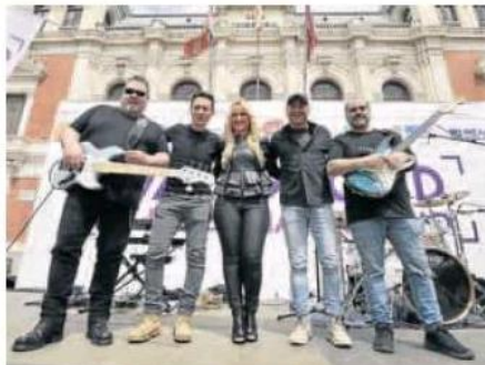
La banda Señorita Pepis ambientó el fin de fiesta ayer.

La edil subrayó que «el público joven ha abarrotado la Plaza Mayor». Los asistentes han tenido la oportunidad de probar diferentes tipos de vinos de las cinco denominaciones de origen que se extienden por territorio vallisoletano (Ribera del Duero, Rueda, Cigales, Toro y León), participar en originales catas a buen precio y disfrutar de los concier-