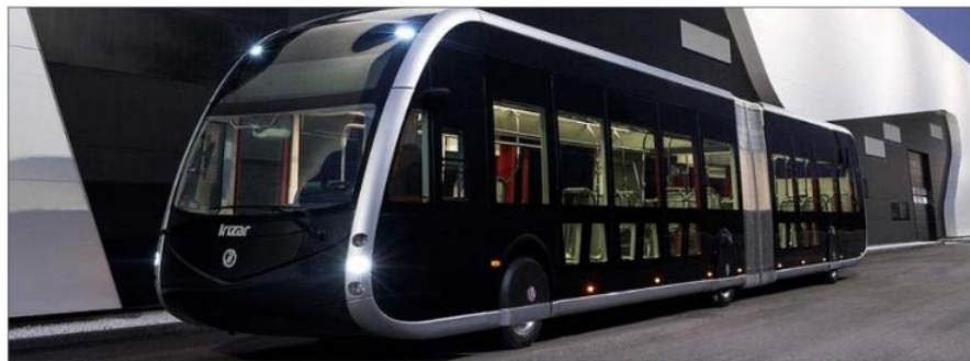
Modelo de autobús que se incorporará a la línea uno de Auvasa. E.M.

Entre las medidas para avanzar en la reducción de emisiones, el Ayuntamiento implantará los distritos climáticamente neutros y en el caso de los edificios municipales el objetivo será la etiqueta carbono cero-neto. En materia de movilidad, la línea a seguir es la que está en marcha para fomentar el transporte público, la descarbonización de las flotas municipales y la intensificación de la circulación sostenible en el transporte de empresas.