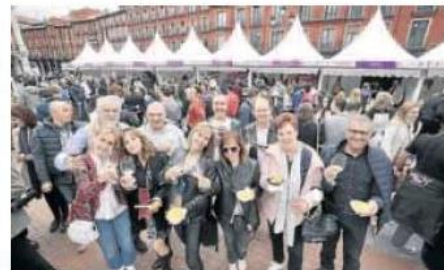
Un grupo de amigos disfrutando de los vinos y las tapas.

Ha empezado la cuenta atrás para pensar en la próxima edición de esta feria que organiza Foro de Debate con el Ayuntamiento de Valladolid como patrocinador principal. Una gran fiesta para los vinos vallisoletanos que patrocina también Reale Seguros e impulsa El Norte de Castilla.