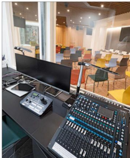
Dotación tecnológica de la sala de conferencias.

Eficiencia. Las obras han servido para mejorar el aislamiento después de constatar problemas de ruidos y vibraciones en las viviendas colindantes. También se han renovado los sistemas energéticos.