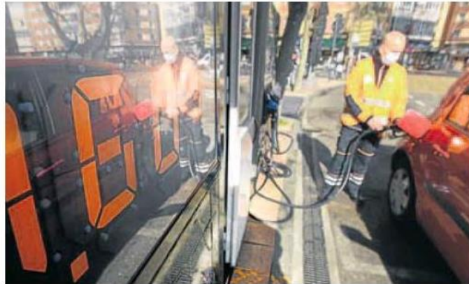
Un vehículo reposta combustible en una gasolinera urbana de Valladolid capital.