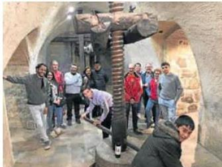
Enoturistas en Eme Bodegas de Fuensaldaña. RUTA DEL VINO CIGALES

tos de los grupos locales Cabeza de Gallo, Bloody Mary, Cañoneros y Señorita Pepis. La Sociedad Mixta para la Promoción del Turismo de Valladolid confirma las cifras que durante los cuatro días del puente han consolidado este encuentro como una gran feria enogastronómica. Los hoteles han registrado una ocupación media del 85% el sábado y del 80% el domingo, por encima del 70% esperado, los restaurantes han estado llenos hasta la bandera y los comerciantes están satisfechos,