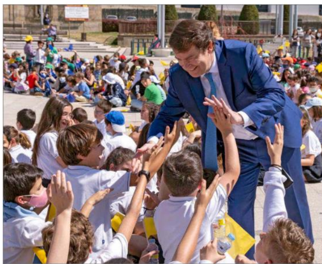
MAÑUECO CELEBRA EL DÍA DE EUROPA CON ESCOLARES SALMANTINOS. El presidente de la Junta celebró ayer el Día de Europa junto a varios centenares de escolares salmantinos. Mañueco asistió al izado de la bandera de la Unión Europea en Salamanca, junto al alcalde y otras autoridades municipales.

Castilla y León escaló siete puestos en un solo ejercicio hasta alcanzar la cuarta posición, solo superada por Madrid, País Vasco y Cana-