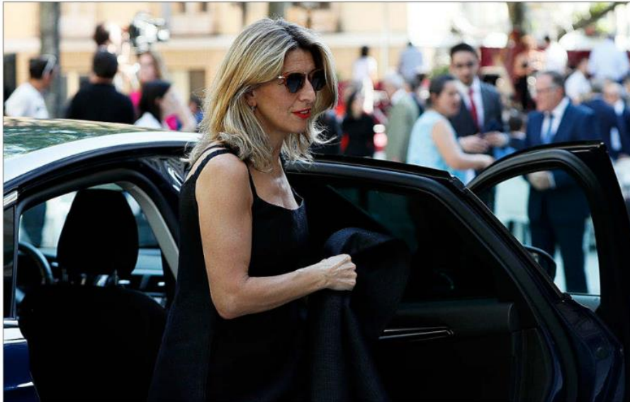
La vicepresidenta segunda del Gobierno, Yolanda Díaz, este lunes acudió a la celebración del Día de Europa en el Senado.