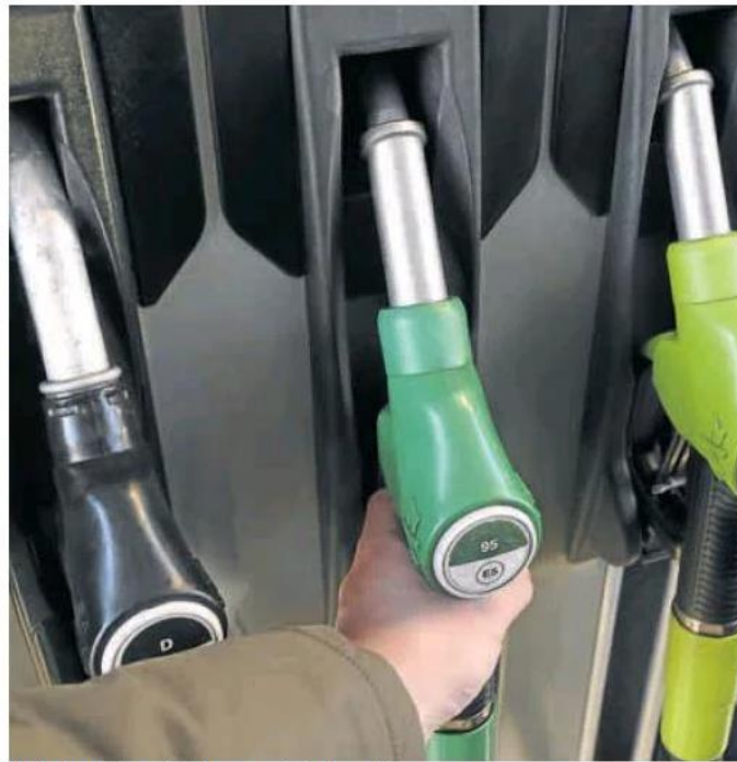
Un cliente reposta combustible en una estación de servicio.

Pero la realidad muestra cómo la escalada de precios ha absorbido ya nueve céntimos de euro de la bonificación en el caso de la gasolina —prácticamente la mitad de lo que se descuenta— y cinco céntimos en el caso del gasóleo,