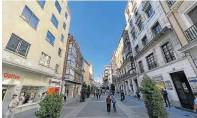
Panorámica del tramo final de la calle Santiago. JOSÉ C. CASTILLO

sede en él. En las próximas semanas, desembarcará en Valladolid Casa Viva, la tienda dedicada a la decoración y el menaje del hogar, que ha elegido el antiguo local de Zara Home en la Plaza Mayor antes de que esta filial de Inditex se mudara a su actual tienda en los bajos de la Casa Mantilla. A la par, Rituals adecúa la tienda contigua (antes de Uterqüe) para ganar espacio de venta -abrirá el 15 de junio- y a ese esquinazo de Claudio Moyano con Santiago llegará Hoff, una marca de moda especializada en zapafillas. También retoma pulso la Acera de Recoletos, que en su primer tramo desde la plaza Zo-