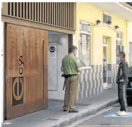
Una oficina del paro en Palencia. MARTA MORAS

menos de 25 años se reduce hasta 8.758, la menor cifra nunca registrada. Un año atrás eran 14.447 y en 2012, más de 25.000.