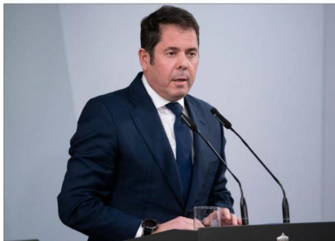
Cepyme, presidida por Gerardo Cuerva, lanza un Indicador sobre la Situación de la Pyme.

Desde Cepyme «se urge a una actuación urgente (tributaria, normativa y crediticia) para facilitar la adaptación de las pymes, donde trabajan casi 9 millones de personas, a un entorno económico que tenderá a complicarse por la evolución de la situación financiera, el fin de la moratoria concursal o la cronificación de la inflación debido a los efectos de segunda vuelta que generan la traslación del IPC a salarios».