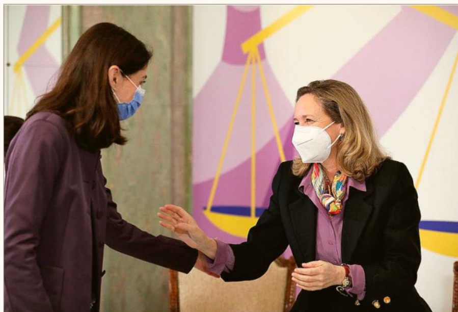
Pilar Llop, ministra de Justicia, con Nadia Calviño, vicepresidenta primera y ministra de Asuntos Económicos.

Por un lado, el objetivo de la nueva legislación es precisamente promover los acuerdos entre deudores y acreedores antes de que se declare el propio concurso de acreedores, lo que en definitiva supone que se podría esperar me-