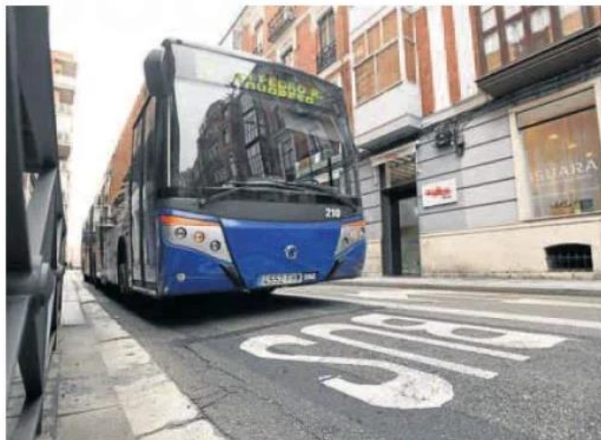
Un autobús de la línea 2 circula por el carril exclusivo para el transporte público de López Gómez.

Las personas transportadas por esta red en esos cuatro meses alcanzan los 3.273.219 de usuarios en días laborables frente a los 2,6