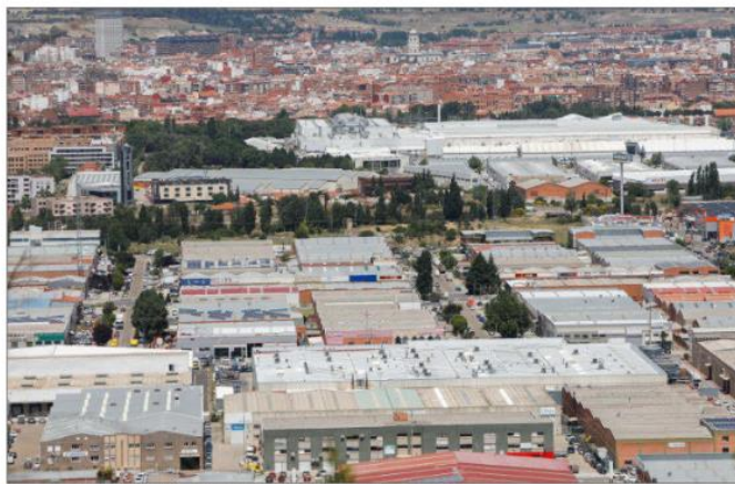
Vista panorámica del polígono de San Cristóbal, en Valladolid. J.M. LOSTAU

De los 1.421 millones de euros, casi la mitad (el 47%), se destinará directamente a los considerados sectores estratégicos: automoción, agroalimentación, energía, hábitat, sector farmacéutico y salud, química y cosméticos, aeronáutica, TIC, industrias cultura-