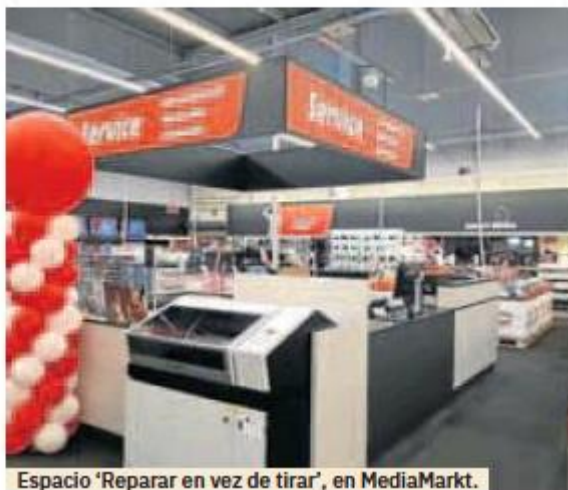
Espacio 'Reparar en vez de tirar', en MediaMarkt.

«Poder brindar una segunda oportunidad a nuestros dispositivos, a través de las reparaciones, o cuidarlos, con un buen servicio de mantenimiento, nos permite alargar su vida útil, contribuyendo así a la economía circular. Además, hacerlo de la mano de nuestros cerca de 300 especialistas entre nuestro HUB en Pinto y los 'Service Point' de nuestras tiendas, es siempre una garantía de éxito»,