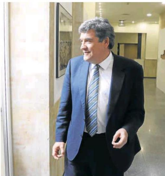
El ministro de Inclusión, Seguridad Social y Migraciones, José Luis Escrivá.

Pero hay otro colectivo formado por los trabajadores que más ganan y que cotizan por las bases máximas, que se sitúa en los 4.139,4 euros, un límite que Podemos quiere eliminar y que esta pasada semana el PSOE votó en el Congreso a favor por error. Se trata de aquellos que tienen unos