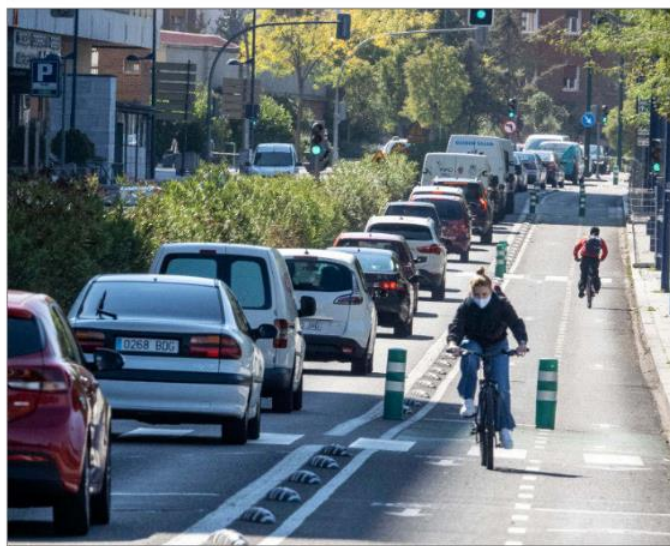
Carril bici en el Paseo de Isabel la Católica.

Frente al argumento del Ayuntamiento de que los cambios sólo afectan a 23 de las 1.800 calles de la ciudad y, por tanto, no puede considerarse que supongan un cambio sustancial, el magistrado sostiene que la afectación al tráfico «no depende del número de calles implicadas» y lo hace con un ejemplo curioso al preguntar qué pasaría si el