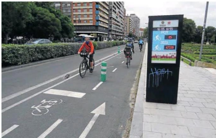
Algunos ciclistas circulan por el carril bici del paseo de Isabel la Católica de la capital. RODRIGO JIMÉNEZ

Así, transitar por las vías exclusivas para el transporte público seguirá estando prohibido. Otra cosa es que la Policía Municipal vaya a ser especialmente celosa en la imposición de multas ante la situación de inseguridad jurídica que conlleva este fallo, en el que se obliga expresamente al Ayuntamiento a devolver «sin dilación ni excusas» las sanciones que se hayan podido imponer en estas vías.