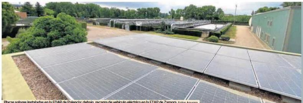
Placas solares instaladas en la EDAR de Palencia; debajo, recarga de vehículo eléctrico en la ETAP de Zamora.

AQUONA. La compañía ofrece soluciones innovadoras para la gestión sostenible de los recursos e impulsa la salud ambiental en Castilla y León