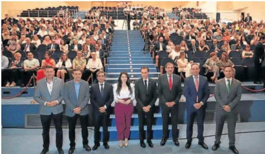
La Diputación de Valladolid celebró ayer el Día de la Provincia en el Auditorio de Íscar.