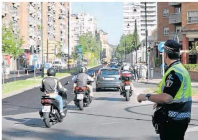
Un agente controla el paso de vehículos durante el asfaltado de uno de los carriles del paseo.

No obstante, el equipo de gobierno local se mantiene firme en los beneficios de esta red de carriles para el transporte público y las dos ruedas. No tiene intención de desmontarla.