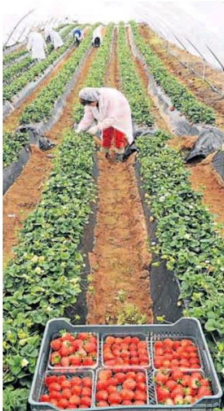
Temporeros de la fresa en Huelva.

José Luis Escrivá confirmó ayer que la prórroga del decreto de medidas contra la guerra incluirá la subida de las pensiones no contributivas pactada con Bildu dentro de las negociaciones para sacar adelante el plan. «Tiene todo el sentido que, del mismo modo que hay una aportación adicional del 15% a los beneficiarios del Ingreso Mínimo Vital (IMV), haya una prestación similar para las personas en edad de jubilación», aseguró ayer el ministro de Seguridad Social sobre una medida de la que se beneficiarían unos 440.000 ciudadanos.