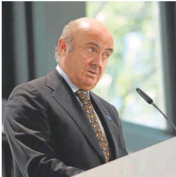
El vicepresidente del Banco Central Europeo, Luis de Guindos, en una imagen de archivo.

La institución advierte del riesgo de efectos de segunda ronda que obliguen a una política monetaria «diferente»