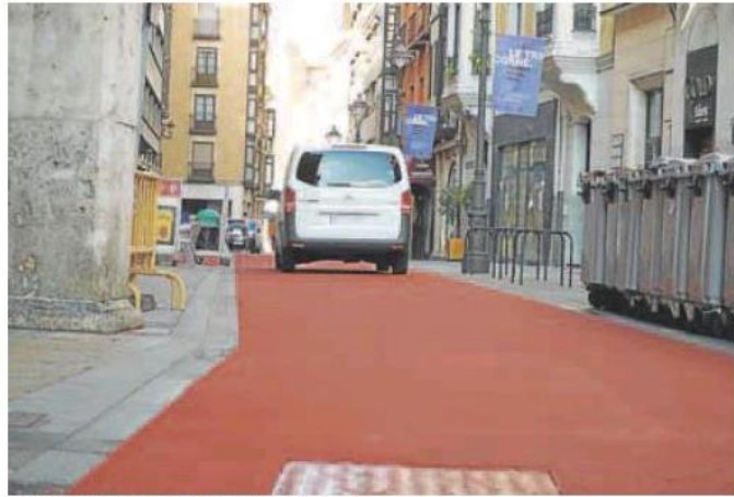
Un vehículo circula por una calle Pasión teñida de rojo.

Valladolid aseguró que la licitación de obra de la estación intermodal para la ciudad que se aprobó el martes en el Consejo de Ministros es «una de las noticias más importantes del siglo», una construcción que contará con una inversión de cerca de los 30 millones de euros y unos plazos que «permiten ser optimistas», informó Europa Press.