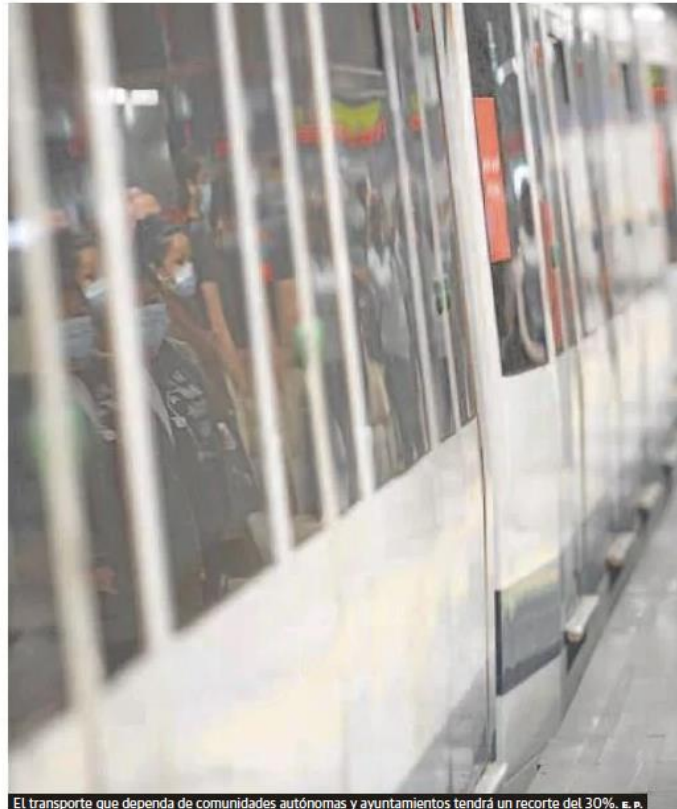
El transporte que dependa de comunidades autónomas y ayuntamientos tendrá un recorte del 30%. e. a.

Más concretamente, la medida va dirigida a trabajadores, autónomos o desempleados que residan en hogares con ingresos inferiores a 14.000 euros, es decir, los hogares que cobren me-