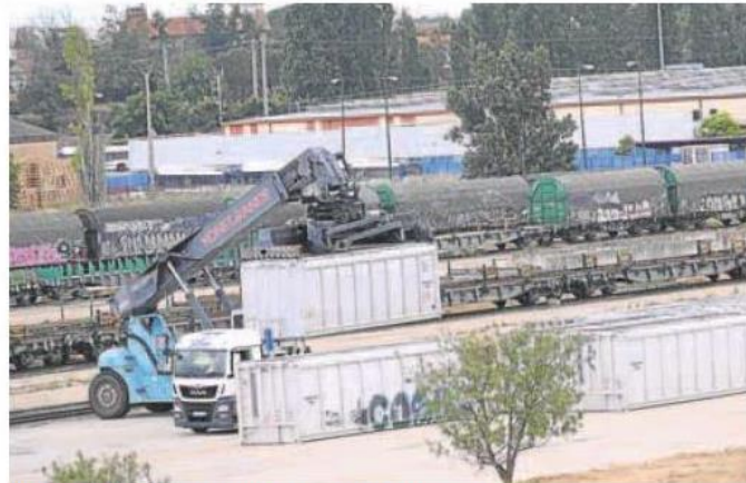
Una máquina portaccontenedores carga en un camión en Argales. RODRIGO JIMÉNEZ

Cuando la factoría de Renault esté enganchada al "by-pass" se levantará la vía que ahora lleva los trenes portacoques desde la fábrica a la estación de Campo Grande. En el caso de Argales, también es fundamental la conclusión de esta arteria ferroviaria de mercancías para despejar las veinte hectáreas que ahora ocupan las instalaciones de Adif, las de Redalsa y el CTV.