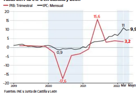
Tasas del PIB e IPC en Castilla y León

El último informe del INE sobre el comportamiento del Índice de