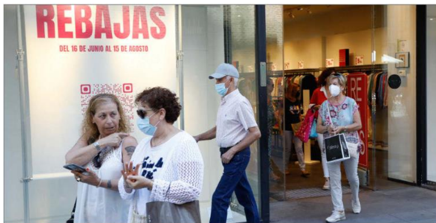
Entrada de una céntrica tienda de ropa en el periodo de rebajas.

Los comerciantes son conscientes de que la subida de precios les afecta a ellos y a los consumidores: «La inflación merma