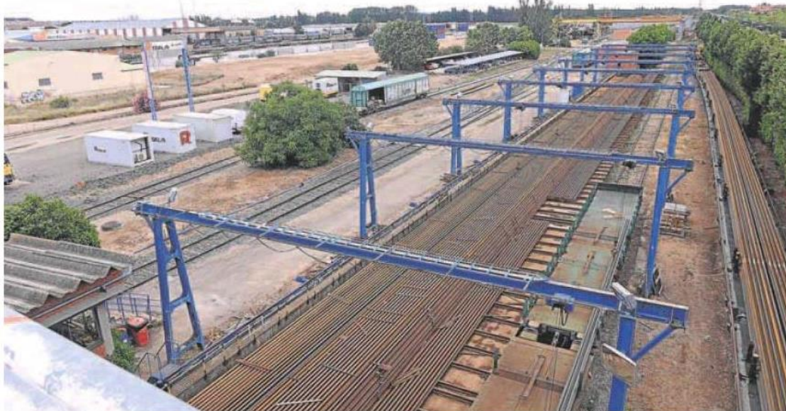
Espacio ocupado por la estación de contenedores de Adif e instalaciones de Redalsa que acogerá el futuro barrio de Argales. RODRIGO JIMÉNEZ