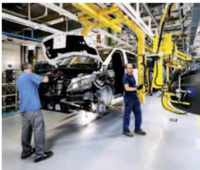
Trabajadores montan vehículos en la planta de Mercedes. r. c.

Tal y como indican los analistas de S&P, «las empresas encuestadas informaron de que las ventas se han desplomado debido a un entorno cada vez más incierto y algunas de ellas prevén una recesión en la segunda mitad del año». Advierten, además, de que los altos precios también afectaron a esa peor evolución de la demanda, con una inflación disparada al 10,8% en julio en el caso de España. Y es que la contracción de la actividad no es exclu-