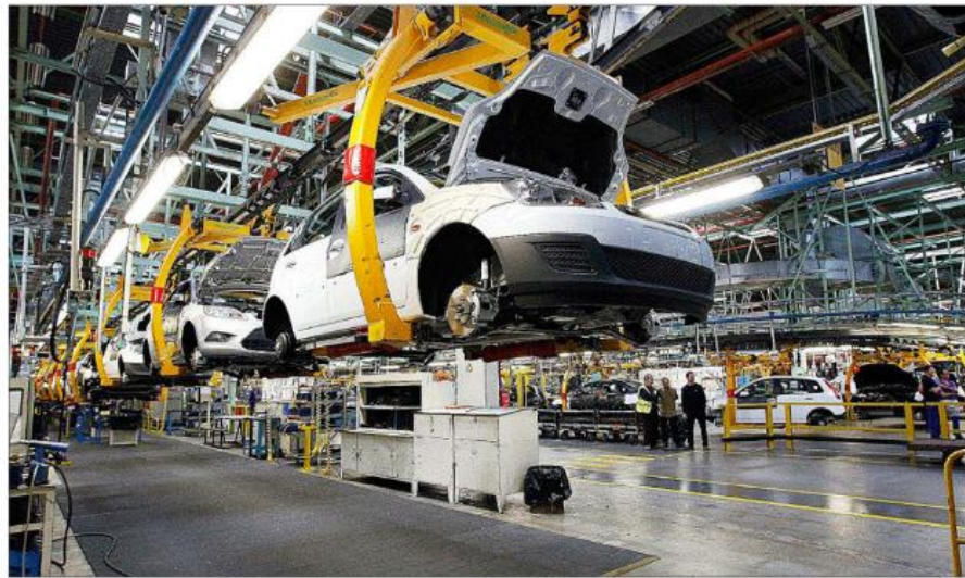
Cadena de montaje de la factoría de Ford en Almussafes (Valencia).

La falta de pedidos llevó a las compañías a recortar la producción —el mayor descenso desde enero de 2021— en respuesta a la disminución de su carga de trabajo, a reducir sus inventarios de almacén y a despedir trabajadores. «El nivel de empleo cayó por primera vez en diecisiete meses», apunta S&P, y agrega que «las empresas están cada vez más preocu-