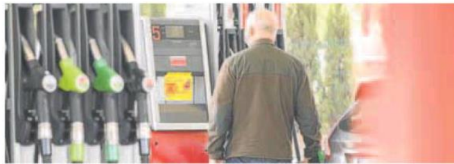
Un hombre echa gasolina a su vehículo en una estación de servicio.