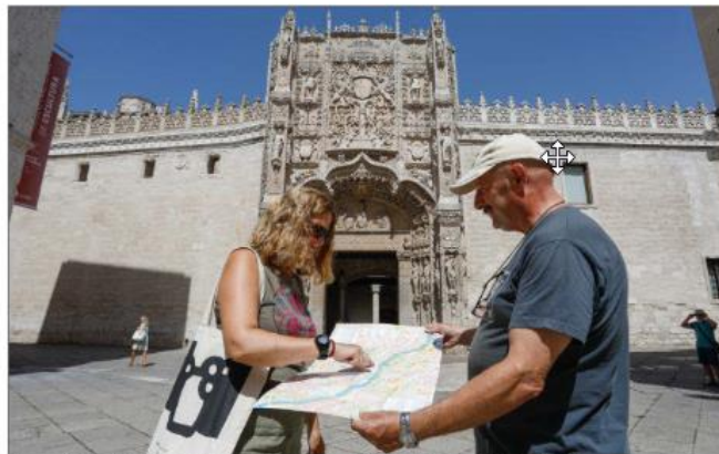
Una pareja de turistas frente al Museo de Escultura en el Colegio de San Gregorio de Valladolid. J. M. LOSTAU

Sin embargo, para el sector del turismo rural el puente también supone la antesala de unos meses de poco trabajo. En palabras de Chico, «a finales de agosto se produce el bajón habitual que se prolonga hasta mediados de septiembre». En este sentido, advierte de que en esta ocasión la temporada más baja podría adelantarse, ya que coincide con la vuelta al colegio y las fiestas de las capitales de provincia y que en su caso son las de Valladolid, previstas entre el 2 y el 11 de septiembre.