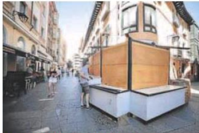
Montaje de una de las casetas de la Feria de Día. CARLOS ESPESO

Dichos puestos empezaron ayer a desplegarse por las calles