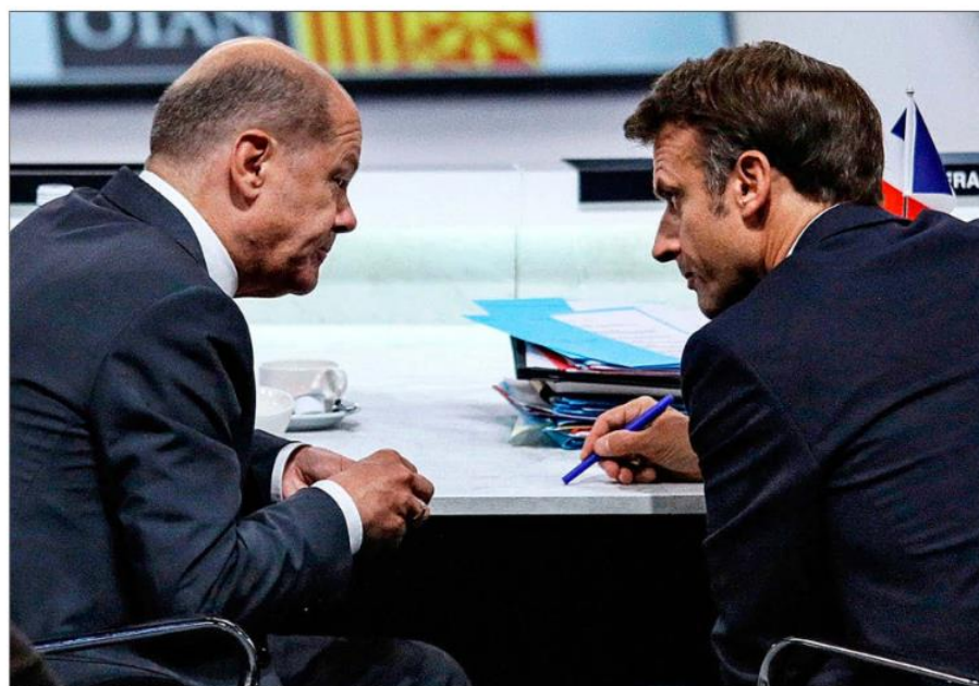
Olaf Scholz, canciller alemán, y Emmanuel Macron, presidente francés.