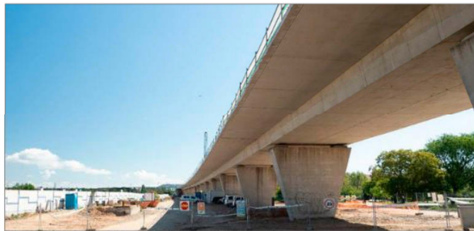
Obras de la Variante Este de Mercancías de la Red Arterial Ferroviaria. ICAI

El tercer bloque trata sobre la construcción de todas las vías necesarias para asegurar el tráfico entre la factoría de Renault, el Complejo y el enlace norte de la Variante, el cual contará con La actuación contempla, asimismo, el montaje de vía en ancho convencional (1.668 mm) del tramo comprendido entre el túnel de San Cristóbal y el final de la Variante Este ferroviaria, donde enlaza con la línea Madrid-Hendaya.