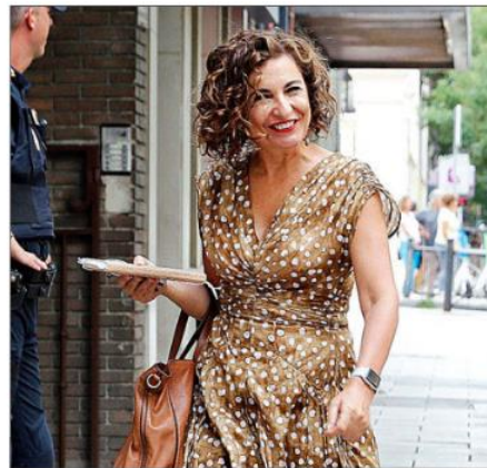
Maria Jesús Montero, ministra de Hacienda.

figura tributaria que también contribuyó a engordar la recaudación. En los primeros siete meses del año, esta figura tributaria ha aportado 69.160 millones de euros, un