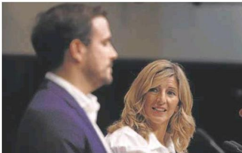
La vicepresidenta segunda, Yolanda Díaz, ayer, junto al ministro de Consumo, Alberto Garzón.