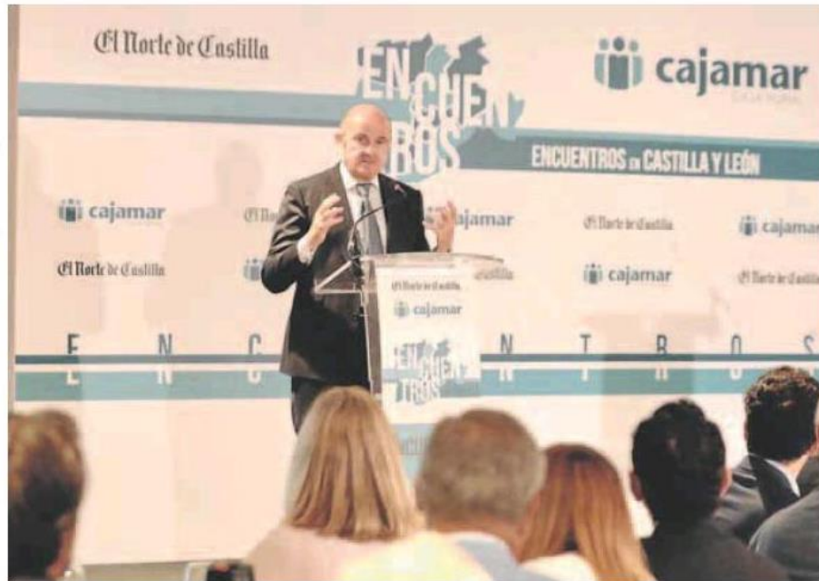
Luis de Guindos, durante su intervención ayer en los Encuentros de Castilla y León, organizados por El Norte.

El que fuera durante siete años máximo responsable de la política económica y de competitividad en los gobiernos de Mariano Rajoy, cuatro días después de que el BCE decidiera subir el precio del dinero un 1,25%, mostró su confianza en que la medida servirá para contener la inflación. Algo que los ciudadanos empezarán a notar a partir de marzo de 2023,