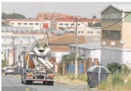
Polígono industrial de Hontoria en Segovia.

Las comunidades autónomas con mayor número de sociedades mercantiles creadas en julio fueron Comunidad Madrid (1.665),