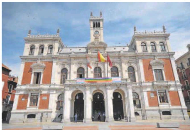
Edificio del Ayuntamiento de Valladolid.

Desde el Consejo se señala que «el Estado ha concedido una ayuda extraordinaria a los ayuntamientos como consecuencia de la covid por la reducción de ingresos en los servicios de transporte urbano; las entidades locales no han recibido otras compensaciones por beneficios fiscales concedidos a los particulares ni tampoco por los desfases en la gestión recaudatoria de los tributos locales». La institución recomienda que las administraciones locales hagan un seguimiento de la incidencia en los datos de recaudación anual ante las medidas adoptadas sobre sus tributos y precios públicos a la vez que informen al Pleno a través de la memoria de las cuentas de recaudación.