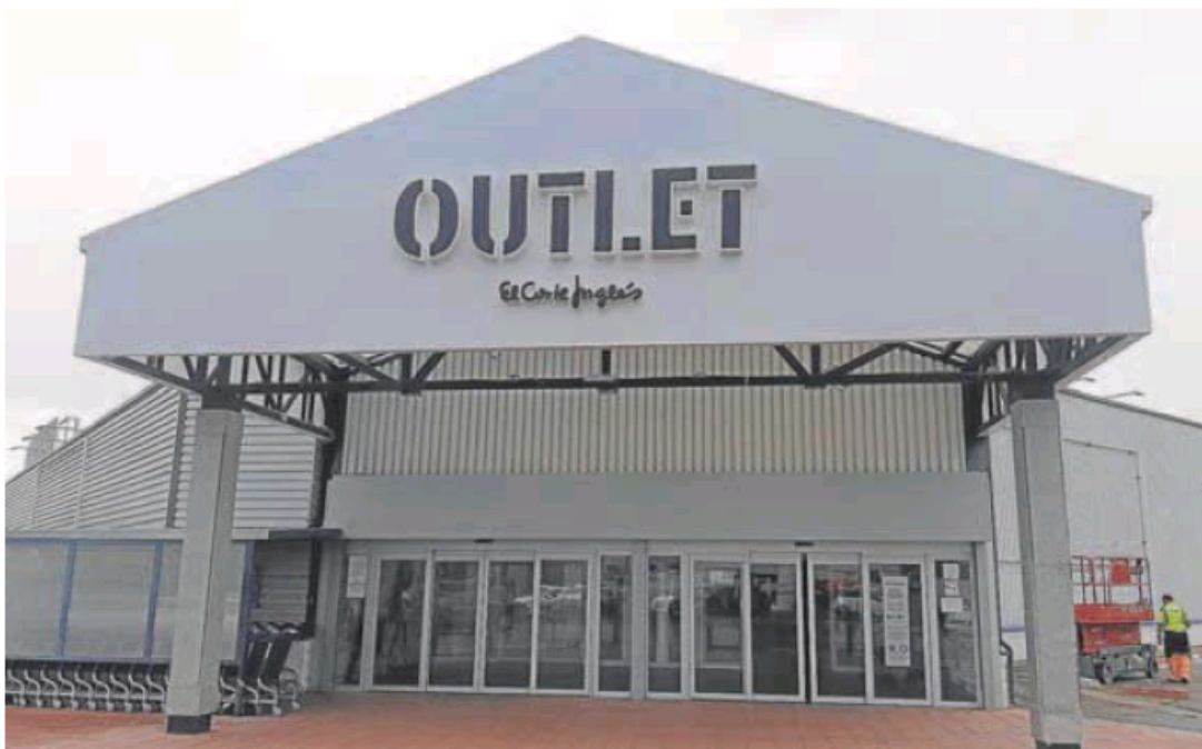
Fachada del nuevo centro de outlet de El Corte Inglés en Arroyo de la Encomienda.