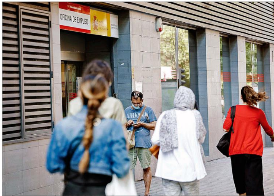
Varias personas pasan ante una oficina de Empleo en Madrid, este verano.

Según recoge el artículo 14.3 del Estatuto de los Trabajadores, la figura del desistimiento permite al empresario extinguir la relación laboral con el trabajador sin causa que justifique su fin y sin indemnización, siempre que sea dentro del periodo de prueba. A diferencia del despido, en el desistimiento sólo hay liquidación y finiquito, con lo que resulta mucho más barato para la empresa. El periodo de prueba puede ser de hasta seis meses para los técnicos titulados y de dos meses como máximo para el resto de trabajadores (o