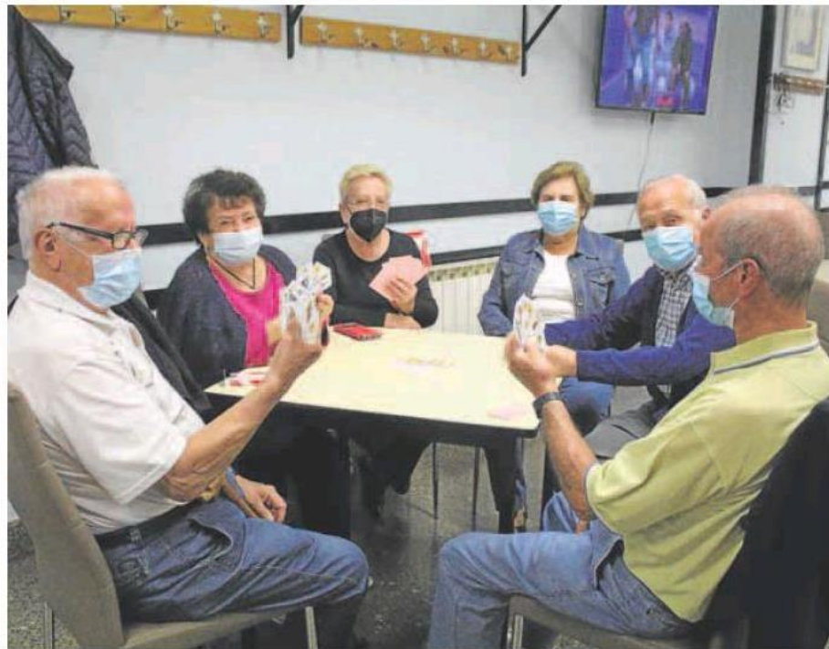
Un grupo de jubilados juega a las cartas.

Significa además que esa propuesta no oficial que circuló por los despachos de La Moncloa de estimar la pensión con los últimos 35 años cotizados habría provocado un tijeretazo en la pen-