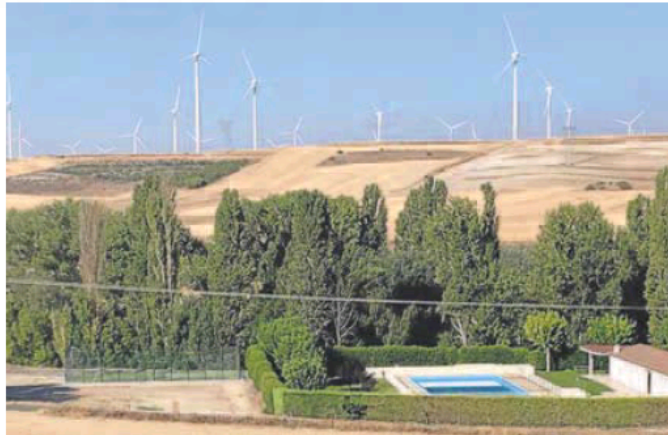
Molinos eólicos en los Montes Torozos desde Peñafior de Hornija.