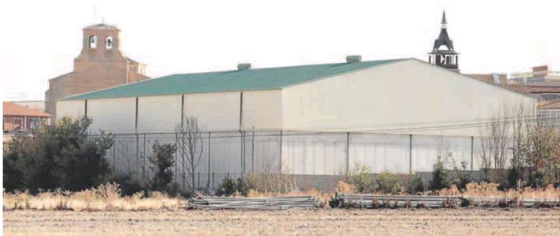
Naves industriales a las afueras de Villalar. CARLOS ESPEJO

«Lo que más ha hecho para que venga gente y se quede en Santibáñez es la fibra óptica»