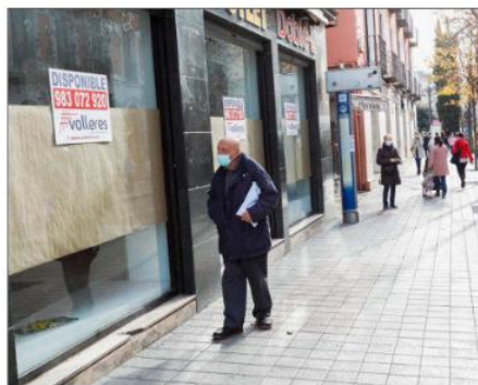
Un comercio cerrado en Valladolid en una imagen de archivo.