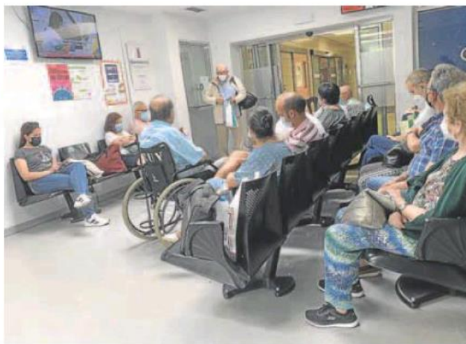
Sala de espera del Hospital clínico de Valladolid.

De esta forma, el año 2020 provocó 68.428 bajas laborales y, el cerrado ejercicio de 2021, otras 50.972 en Castilla y León, según los datos de la Consejería de Sanidad. Bastante más del doble que los lumbagos y demás dolores de espalda que habitualmente son los principales responsables de la ausencia por enfermedad. El año pasado ocasionaron 21.239 y más del cuádruple de la siguiente razón para no poder acudir a la oficina, la de la ansiedad, que en 2021 ocasionó 11.356 casos de incapacidad transitoria. Las gastroenteritis (9.309) y otros procesos respiratorios (3.465) se quedan muy lejos de la cifras de la covid y, en 2021, la gripe ni siquiera aparece entre los diez