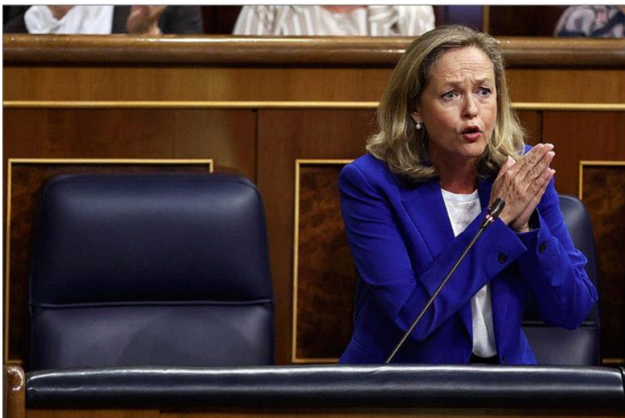
La vicepresidenta primera y ministra de Asuntos Económicos, Nadia Calviño, durante una intervención en el Congreso.