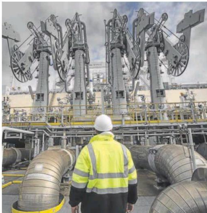
Planta de descarga de la regasificadora de Mugarlos (La Coruña). MIGUEL MUÑOZ

El precio de las materias primas también se vio condicionado por la nueva etapa en la que ha entrado el conflicto en Ucrania, con esa llamada parcial a la movilización de los ciudadanos rusos, e incluso con amenazas nucleares. El coste del gas llegó a repuntar ayer más de un 10% hasta alcanzar los 210 euros/MWh. Era previsible que así ocurriera. Porque cada episodio de tensión desde febrero se refleja directa y rápidamente en el precio del gas natural, del que Rusia es uno de los grandes productores mundiales y abastecedores de la UE.