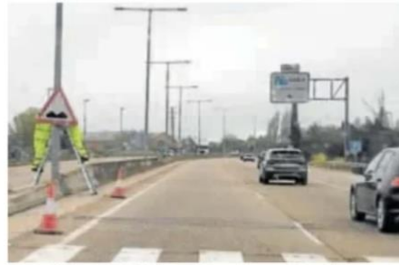
Colocación de una señal de baches el pasado lunes en la ronda este. v.v.

Estos indicadores de pavimento defectuoso se suman a los que, desde la pasada Semana Santa, se han instalado en varias vías de acceso a la capital vallisoleta-