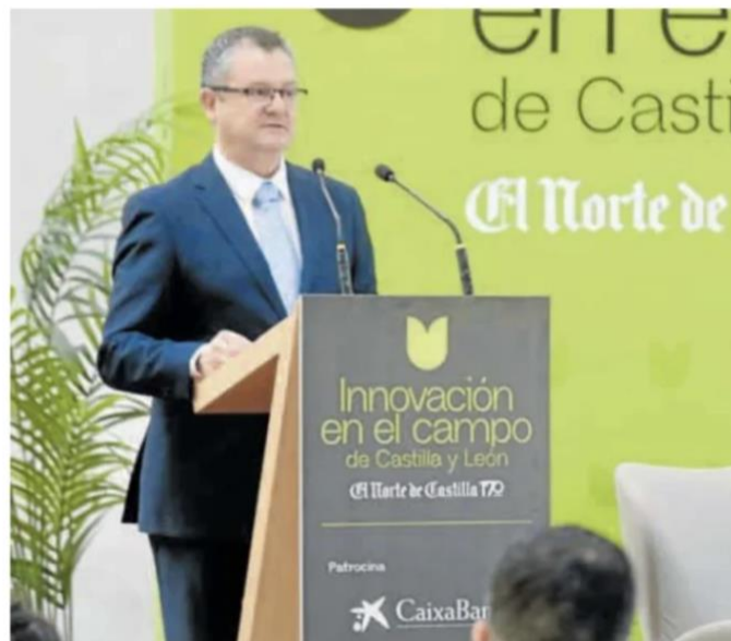
El consejero de Agricultura, Ganadería y Desarrollo Rural durante su intervención en el foro.

De igual modo, fruto de la inversión acumulada en innova-