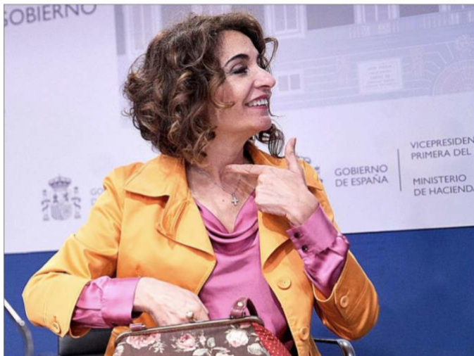
La vicepresidenta primera y ministra de Hacienda, María Jesús Montero.