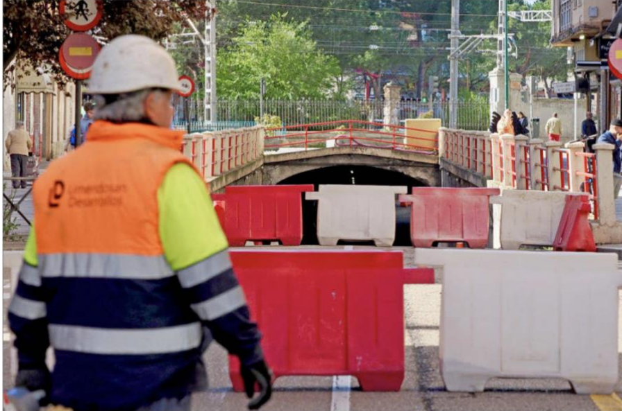
El túnel de Labradores está cortado al tráfico desde mediodía de ayer y cuando se reabra en ocho meses lo hará solo en sentido centro. PHOTOGENIC