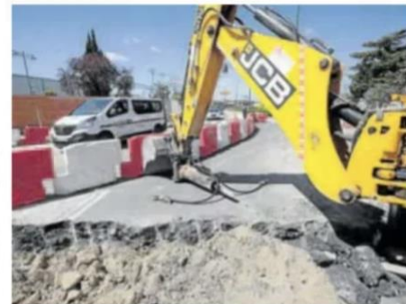
Obras en Arca Real con la Avenida de Zamora. c. ESPESO

Las obras de urbanización en la calle Arca Real, entre la avenida de Zamora y la calle Bronce, co-