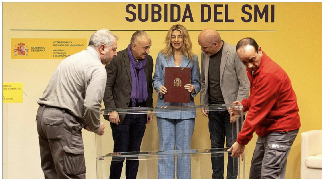
La vicepresidenta segunda, Yolanda Díaz, rodeada de los secretarios generales de UGT (izquierda), Pepe Álvarez, y CCOO (derecha), Unai Sordo, y varios miembros de sus equipos.