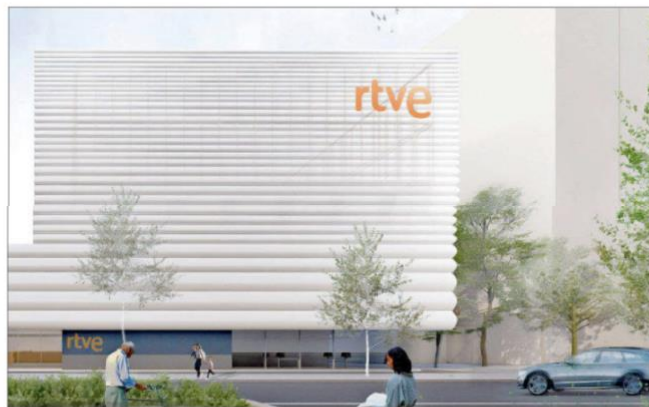
Infografía del nuevo Centro Territorial de RTVE según el proyecto. E. M.

Ese fue el acuerdo aprobado en la reunión del órgano de Gobierno, presidida por el alcalde, Jesús Julio Carnero, aunque fuentes municipales han emplazado a una rueda de prensa que se celebrará hoy miércoles para dar a conocer más detalles sobre el proyecto y su tramitación, informa Europa Press. El inmueble del convento, situado entre las calles Santo Domingo de Guzmán, San Quirce y San Agustín, costó a las arcas municipales algo menos de 6 millones de euros. En el año 2022 se aprobó un Plan Director que ya recogía la creación de un Centro de la Cultura del Vino, dentro de un complejo que incorporaría además un Centro cívico y deportivo y un espacio para ampliar las instalaciones del Archivo municipal.