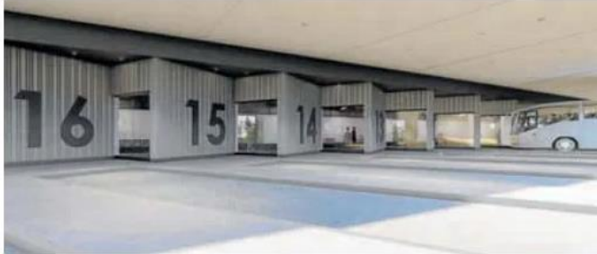
Zona de las dársenas. JCVL