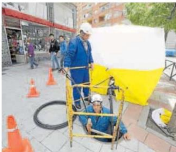
Operarios instalan fibra óptica en una calle de Valladolid.

«El objetivo del Gobierno de España es poner fin a la brecha digital, se viva donde se viva, y a día de hoy podemos decir que este objetivo se ha conseguido,