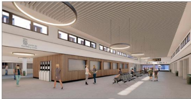
Recreación del interior de la estación de autobuses tras su remodelación. E.M.