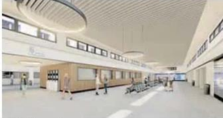
Interior de la estación. JCVL