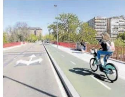
Una ciclista en el puente de Poniente el viernes pasado. A. MINQUEZA

«La incoherencia de Carnero es que hace nueve meses, en el pleno de julio, votó en contra de la moción en la que se instaba a la reforma urgente de la estación y a garantizar su adecuado mantenimiento; es decir, PP y Vox rechazaron todas las iniciativas planteadas por el PSOE para poner fin a la imagen agonizante de la terminal», recaló.