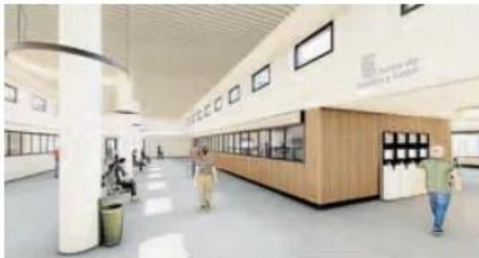
Zona del interior de la terminal. JCVL