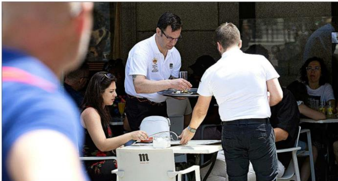
Camareros en una terraza de la calle Arenal, en Madrid. JAVI MARTÍNEZ