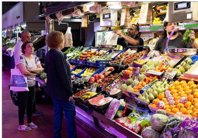
Un puesto de frutas y verduras frescas en el madrileño mercado de la Cebada.

El real decreto que tiene Teresa Ribera en el cajón desde finales del año pasado, cuando pasó el trámite de consulta pública, está incluido en el Plan Anual Normativo de 2024, elaborado por el Ministerio de la Presidencia. Fuentes al tanto del estado de tramitación de esta norma que actualizará el reglamento de reutilización de las aguas adelantan que el siguiente paso es la aprobación por parte del Consejo Asesor de Medioambiente, para su posterior debate en Consejo de Ministros. «Estamos en el último tramo de la tramitación y está todo en el aire por una cuestión de competencias. Esperamos que se haga un análisis serio y que la modificación salga adelante», concluye la responsable de Sostenibilidad de FIAB.