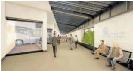
Lugar para la espera de los viajeros donde aparcan los vehículos. JCVL