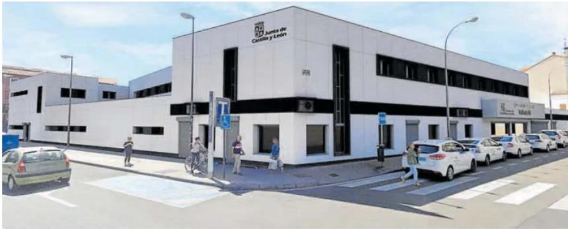
Recreación de la estación de autobuses, con la entrada por la calle San José. JCVL