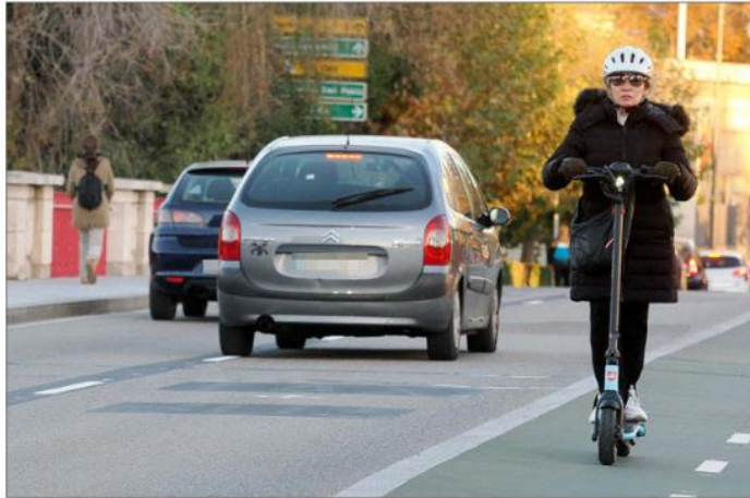
Vehículos y peatones en el Puente de Poniente en la capital vallisoletana.