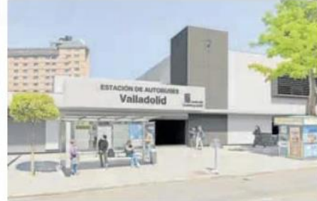
El futuro acceso por Puente Colgante. JCVL