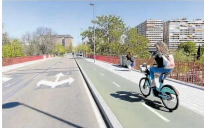
Una ciclista circula por el puente de Poniente, en una imagen de archivo. ALBERTO MINGUEZA

Precisamente la ocultación de las vistas por parte de las mamparas, así como la suciedad que se podría acumular en las mismas, ha sido uno de los objetivos de muchos de los ataques vertidos en redes sociales, que también iban orientados al presupuesto y a la necesidad de realizar la ampliación. Fruto de la disconformidad ha nacido una iniciativa en Change.org para recoger firmas en contra del proyecto de ampliación del puente de Poniente. En la petición, que ya lleva más de mil firmas desde que su publicación el pasado viernes, se define el proyecto como «despilfarro innecesario de recursos públicos».