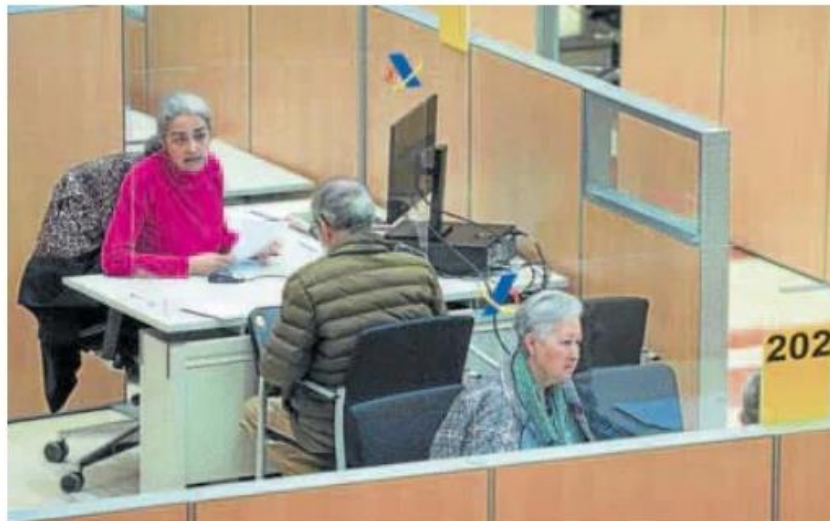
Contribuyentes haciendo su declaración en las oficinas de la Agencia Tributaria. VIRGINIA CARRASCO