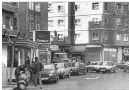
Gasolinera de Campsa (luego de Repsol) de Poniente, en 1991. H. SASTRE

tener las instalaciones en la vía pública de forma innecesaria. Hemos solicitado que, en caso de que la empresa energética no ejerza su obligación, se proceda por parte del Consistorio a ejecutarlo subsidiariamente, cobrándole al titular lo que corresponda», explicaron entonces fuentes del partido.