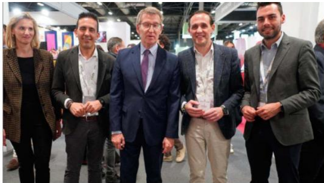
Feijóo con Conrado Íscar durante la visita al stand de Alimentos Valladolid. E.M.