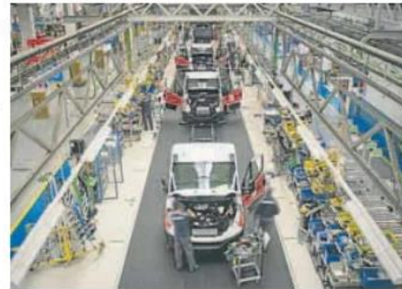
Fábrica de Iveco en Valladolid, en una imagen de archivo.

El grueso de las exportaciones de Valladolid se concentra en el automóvil (60,1%) y en las semimanufacturas (23,7%), sectores en los que se encuadran 79 y 291 empresas, respectivamente. Paradójicamente, la mayoría de las empresas que venden al exterior de la provincia vallisoletana, hasta 664, se dedica a la comercialización de alimentos, mientras que solo 12 distribuyen productos energéticos. Precisamente este último campo registró el incremento más acentuado en 2023 junto con las manufacturas de consumo, con aumentos que superaron el 80%. La otra cara de la moneda fueron las materias primas, que experimentaron un retroceso del 21,8%. Otro dato interesante es el importe de la venta media por empresa, que ascendió a 3,84 millones de euros, y donde los dos extremos fueron la automoción (48,05 millones) y otras mercancías (10.000 euros).