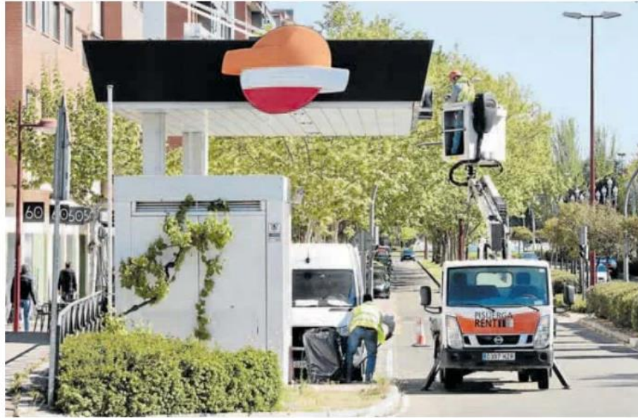
Operarios desmontan la gasolinera de Zorrilla, cerrada desde septiembre del año pasado.

Así, desde que los surtidores dejaran de llenar los depósitos de las decenas de coches y motocicletas que cada día paraban allí, estas instalaciones, aún sin funcionar, formaban parte del mobiliario urbano de la ciudad, fijadas junto a la calzada, en zonas peatonales. Precisamente, hace apenas un mes el Grupo Municipal Socialista criticó la «dejadez» del equipo de Gobierno «por consentir que formen parte del mobiliario urbano cuando deberían estar desmanteladas» y les instó a que requirieran a Repsol que las desmontara de manera inmediata. «La falta de diligencia del gobierno municipal a la hora de gestionar con la empresa este desmontaje está llevando a