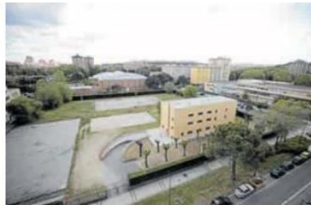
Parcela en la que se situará el nuevo Mercadona. C. ESPESO

Por el momento la compañía no ha avanzado fechas ni más de-