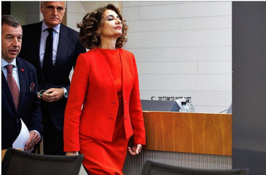
La vicepresidenta primera y ministra de Hacienda, María Jesús Montero.