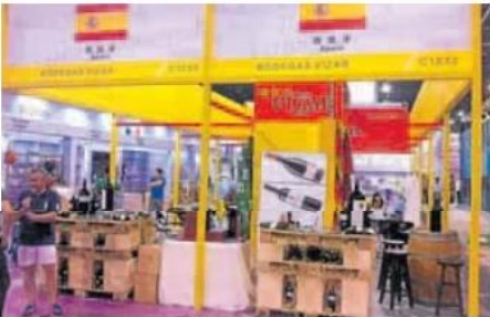
Expositor de una bodega vallisoletana en la feria de Yiwu, en China. A. S.

En el segundo puesto se sitúa un paquete donde entran desde reactores nucleares a calderas, máquinas –por ejemplo grúas, turbinas o motores–, aparatos como los de aire acondicionado, artefactos mecánicos y las piezas o componentes de todos ellos, que suponen 1.657,8 millones, el 21,9% del total. Y a continuación el caucho y sus manufacturas, que acumulan un reseñado 15,7%.