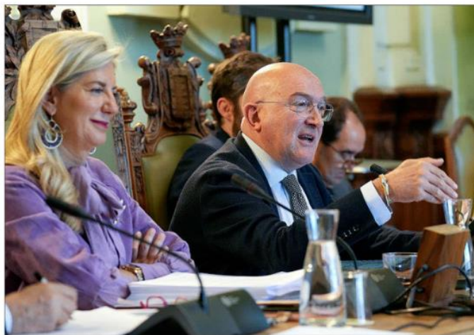
Carnero durante una de sus intervenciones en el pleno.

Para Herrero, la auditoría es «una excusa» que demuestra que el equipo de gobierno «es absolutamente incapaz de hacerse con la empresa» y, como segunda lectura, dijo que quieren utilizar la auditoría para cargar contra el ex gerente de Auvasa.