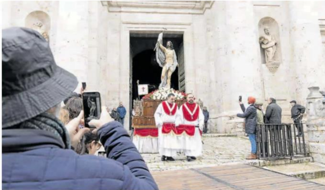
Un hombre fotografía con el móvil la salida del Resucitado de la Catedral rumbo a la iglesia de Porta Coeli. ALBERTO HINQUEZA