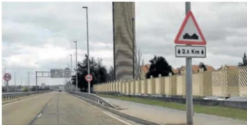
Carteles que avisan de los baches en la VA-20, a la altura de Mercaolid. v. v.