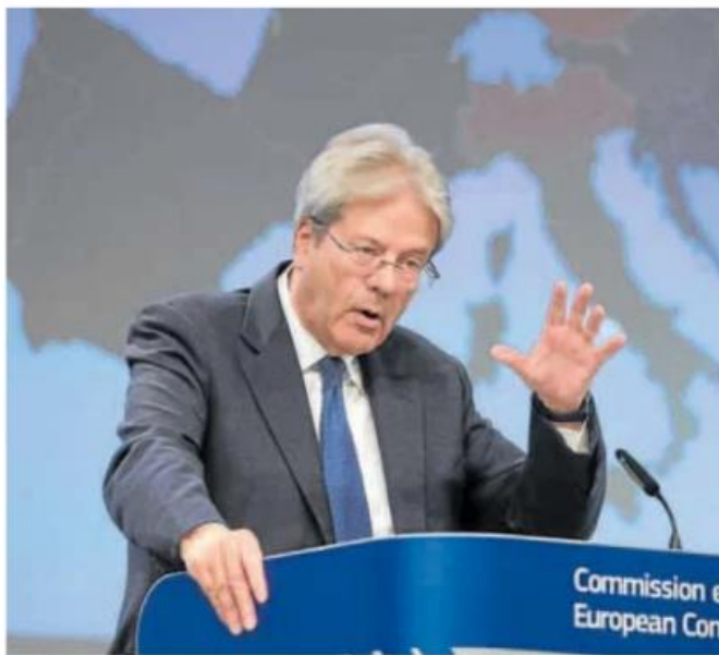
El comisario europeo de Economía, Paolo Gentiloni.

El comisario de Economía, Paolo Gentiloni, ha asegurado abiertamente que «España está en mejor forma que el conjunto de la UE» y los fondos de recuperación han jugado un papel clave en ese