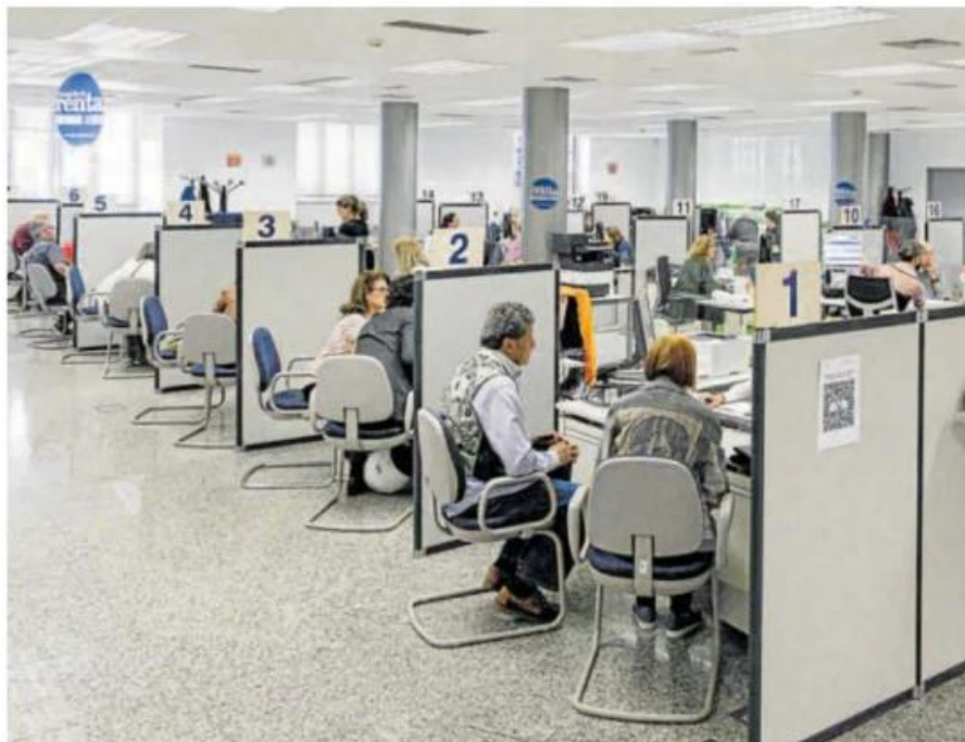
Varias personas son atendidas en las oficinas de la Agencia Tributaria durante la Campaña de Renta del año pasado.