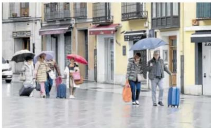
Los turistas abandonan el centro de la ciudad este Domingo de Resurrección, paraguas en mano. A. HINQUEZA

VALLADOLID. La Semana Santa de 2024 pasará a la historia por ser la que peores datos ha contabilizado en cuanto a salidas procesionales. En concreto, la edición recién concluida registró 27 procesiones suspendidas siendo únicamente 11 las celebradas con absoluta normalidad y dos las suspendidas al comienzo de su recorrido. Una estadística especialmente negativa en los días grandes de la Pasión, entre el Jueves Santo y el Domingo de Resurrección, en los que solo se pudieron salvar la Procesión General y La Soledad, en la tarde-no-