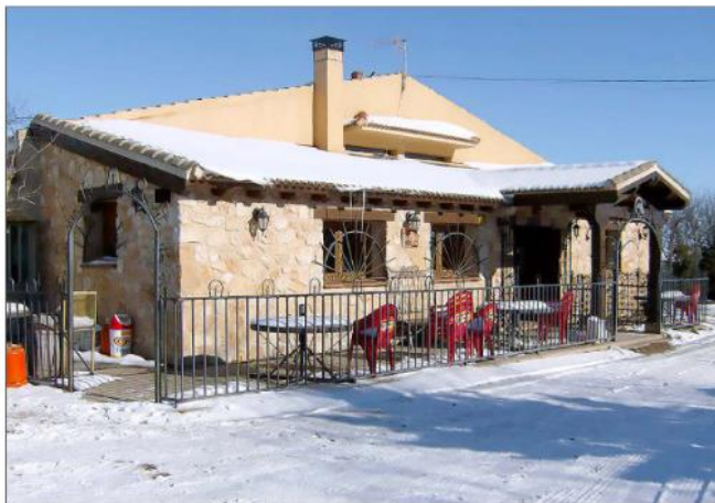
Casa rural en la provincia de Segovia cubierta por la nieve, en una imagen de archivo.