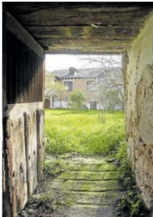
Interior del convento de Santa Catalina de Siena. ALBERTO MINQUEZA

La reconversión del complejo es uno de los proyectos más relevantes del nuevo Plan de Turismo para el periodo 2024 - 2027, presentado el pasado viernes por el alcalde y la regidora del área. Durante el mismo se anunció el desarrollo de un proyecto para la creación del Centro de la Cultura del Vino, que tiene por objetivo albergar catas de caldos y la celebración de un Premio Nacional del Vino para galardonar a los mejores enólogos de toda España. La aprobación del contrato para la redacción del proyecto vitícola estaba prevista que se adoptara