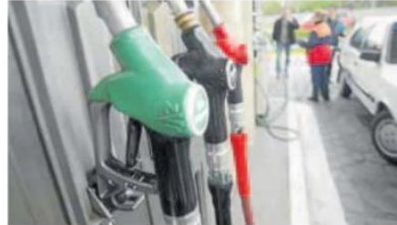
Surtidores de combustible. IGOR AIZPURU

En el caso del diésel, el precio ha aumentado el 3% respecto a