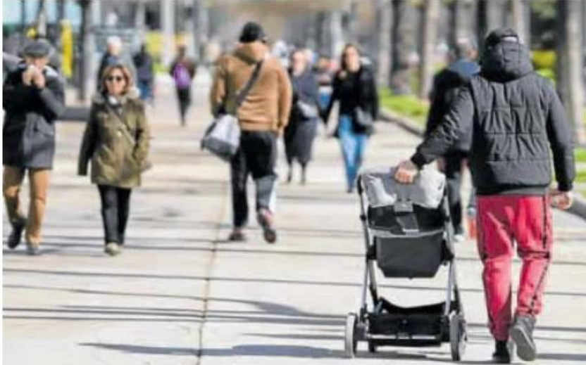
Ciudadanos paseando por un parque de Madrid.