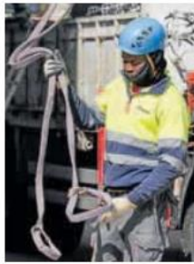
Un obrero en Madrid. O. CHAMORRO