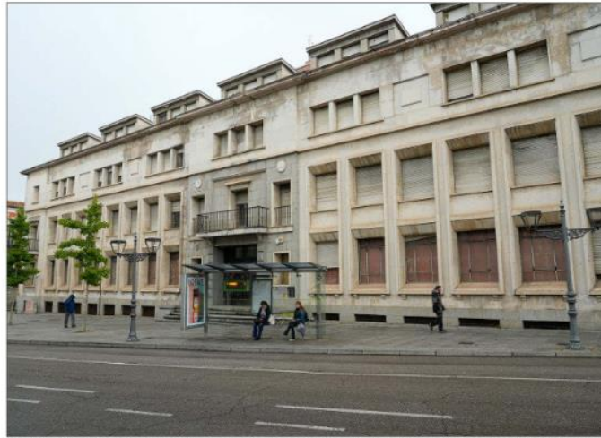
Edificio del antiguo colegio El Salvador, en una imagen de ayer, donde se levantará el campus judicial. LOSTAU

Todo ello ha llevado, a su juicio, a que se haya «perdido el año 2023» en el calendario que preveía el concurso de ideas, la aprobación del proyecto y la licitación de la obra durante el año 2023, y la realización de las obras desde el 2024 al 2027, en su pri-