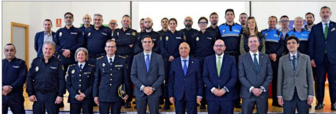
Iberdrola forma a las Fuerzas y Cuerpos de Seguridad de Medina del Campo para actuar en situaciones de riesgo en instalaciones eléctricas. E.M.