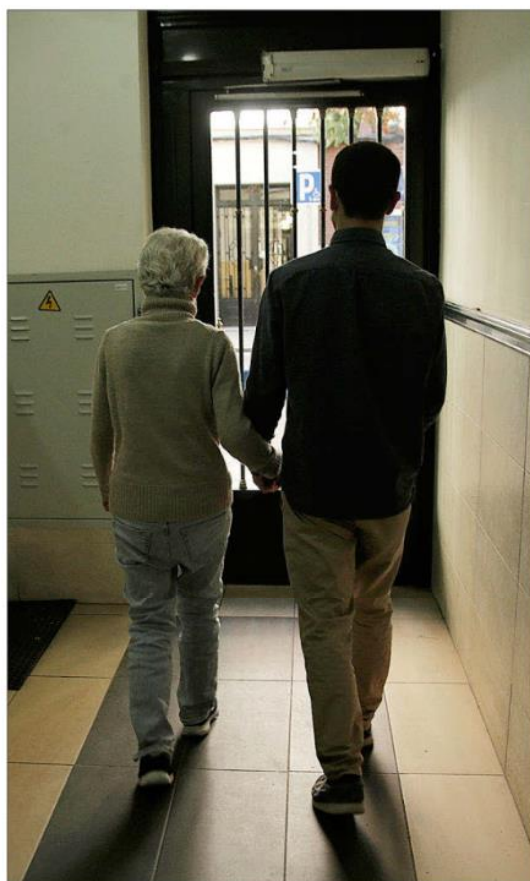
Un hombre camina junto a su madre a la que cuida en Madrid.

El INE empezó a contabilizar en el año 2005 cuantas personas estaban inactivas por este motivo. Entonces eran 897.500, pero la cifra fue descendiendo poco a poco -incluso en los años de crisis- hasta la irrupción de la pandemia. El año 2020 terminó con 473.200 personas en esa situación,