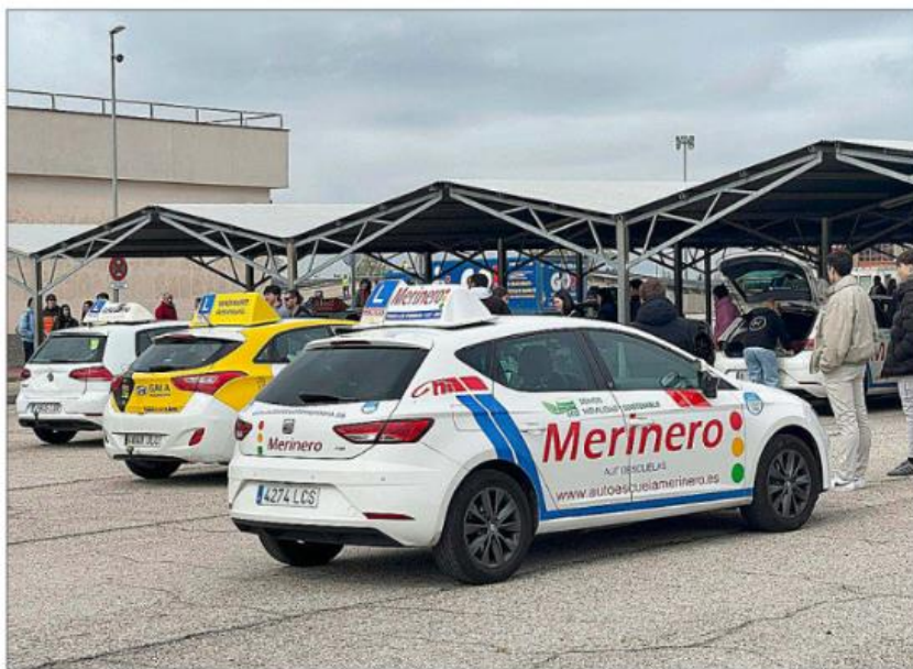
Coches de autoescuela en el centro de exámenes que la DGT tiene en la ciudad de Móstoles.

Según el informe elaborado por la propia CNAE a partir de los datos publicados por DGT sobre la evolución en los últimos años, «en el caso concreto del permiso B [el que sirve para los turismos] el número de expedidos en la franja de 18 a 20 años cre-