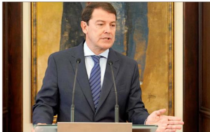
Alfonso Fernández Mañueco en la rueda de prensa de este viernes posterior al anuncio de la ruptura del pacto.

Ante este escenario la nueva Junta, ahora solo bajo las siglas del Partido Popular, confía en que una vez que los presupuestos y la ley de acompañamiento lleguen a las Cortes reciban el apoyo de los trece procuradores de VOX para así salir adelante, según fuentes consultadas por este periódico. Pese a la ruptura del pacto de gobierno por parte de VOX tras el anuncio de la acogida de 21 niños inmigrantes, representantes de ambas formaciones han insistido en la sin-