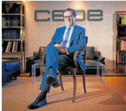
Antonio Garamendi, en la sede de la CEOE en Madrid.

—¿Le digo la verdad? Ninguno. No voy a entrar en ese juego. Nosot-